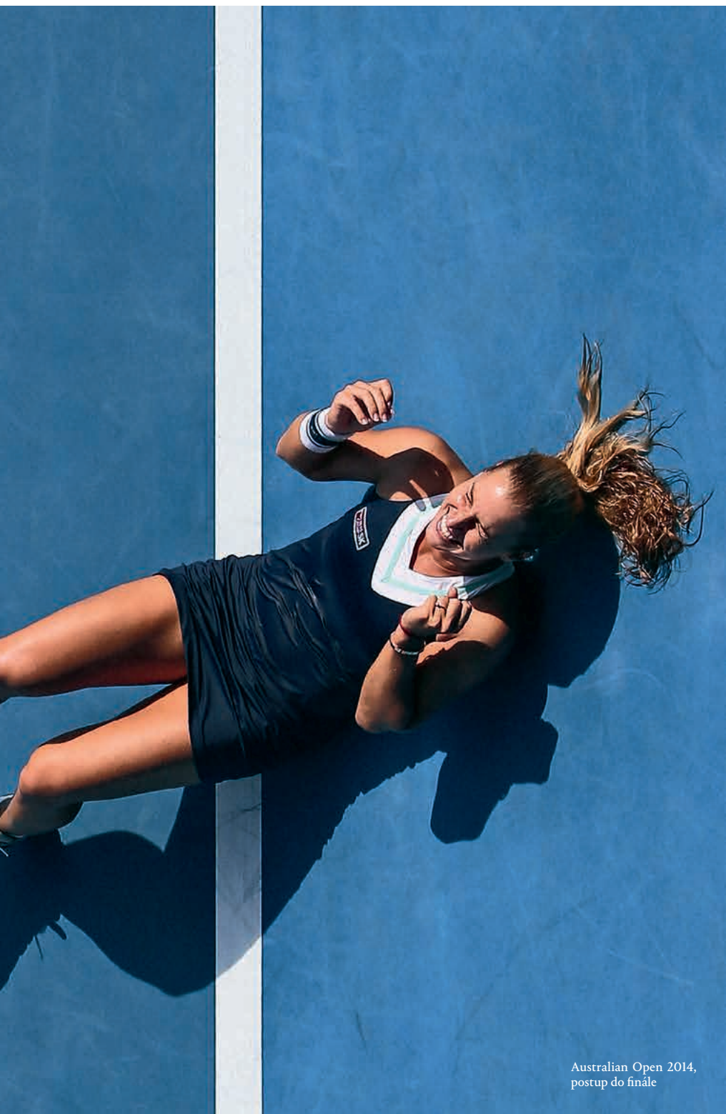
Australian Open 2014, postup do finále