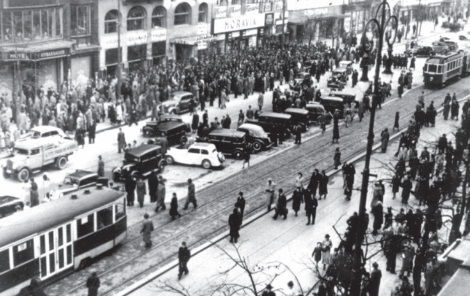
Demonštrácia 28. októbra 1939 v Prahe za účasti českých a slovenských študentov.

hodinami ľudí v centre pribúdalo. Aj keď sa dav podarilo na jednom konci rozohnať, hneď sa vytvoril na inom mieste. Demonstranti prechádzali z ulice do ulice, čím boli pre policajtov nepolapiteľní.