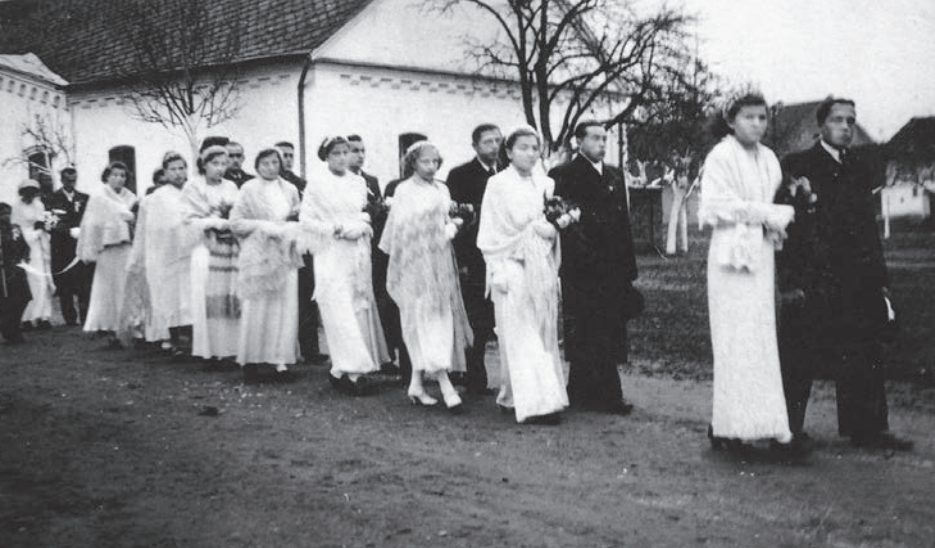
Jana Opletala v rodnej Lhote symbolicky odprevadili aj mladé svadobné páry.

vo zobrať so sebou aj svojho zraneného osobného šoféra, aby vodca videl, čoho všetkého sú študenti schopní. Rozčúlený Hitler zvyšoval hlas a nakoniec rozhodol – všetky vysoké školy zatvoriť, vodcov popraviť a študentov odviecť do koncentračného tábora! Otázne je, či sa rozhodol sám, alebo mu to niekto poradil. Himmler či Bormann, ktorí boli prítomní na porade? S návrhom najskôr prišiel Frank, naňho sa to najviac podobalo. Svedčí o tom aj to, že jedine naňho sa Hitler obrátil, aby dozrel na vykonanie rozkazu, čím mu dal plnú moc. Ešte z Berlína telefonoval Frank do Prahy a zvolal do Petschkovho paláca tajnú poradu – pozval na ňu veliteľa pražského gestapa, veliteľa nemeckej bezpečnostnej polície v Prahe a šéfa gestapa v Brne.