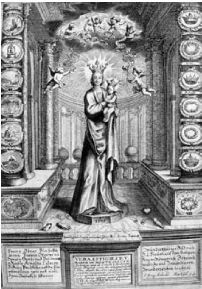
■ Obrázek 1 Panna Maria Svatohorská, u nohou jí leží obětiny, B. Balbin, Přepodivná Matka svatohorská , 1666

Na dnešního člověka mohou poněkud rozporuplně působit katolíkům dobře známé voskové obětiny. Šlo o drobné, duté, trojrozměrné voskové odlitky, které představovaly různé velké napodobeniny nemocných orgánů a končetin, lidských postav, zvířat, rostlin, staveb či věcí denní potřeby. Určeny byly především k prodeji poutníkům, kteří skrze ně žádali splnění prosby nebo vyjadřovali své díky tomu ze svatých, který byl v tom kterém místě předmětem kultu. Tak například mladá vdaná žena toužící po miminku vykonala pouf k místu, kde se uctíval některý ze svatých, a obětovala voskovou figurku děťátka v peřince, modlic se při tom za brzké početí. A naopak, šťastná rodička přicházela obětovat figurku miminka s díky za narození zdravého potomka.