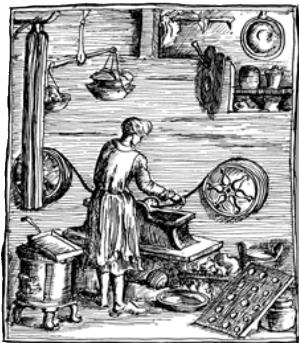
■ Obrázek 2 Voskař při výrobě svíček tažením, podle reprodukce rytiny z knihy Ch. Weigela Abbildungen der Gemein-Nützlichen Hauptstände, Regensburg 1698

Móda rokoka a biedermyera dokázala také využít. Ukázal se být vhodným materiálem pro tehdy velmi populární žánrové obrázky, portrétní medailony, drobné upomínkové a dekorativní předměty.