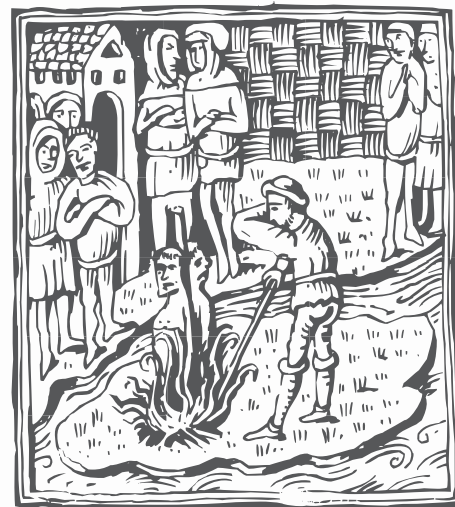
■ Upálení velmistra Jakuba z Molay a velkopreceptora Geoffreye z Charney (podle rukopisné Kroniky Francie ze 14. stol.).