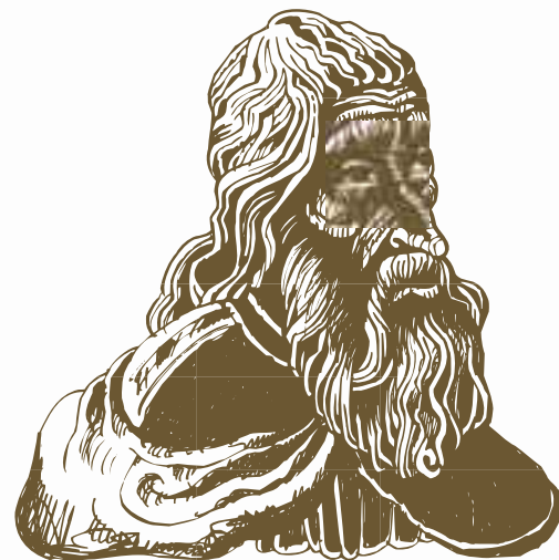
■ Poslední templářský velmistr, mučedník, Jakub z Molay (podle Michelet, J. – Rekové a rebelové sladké Francie)