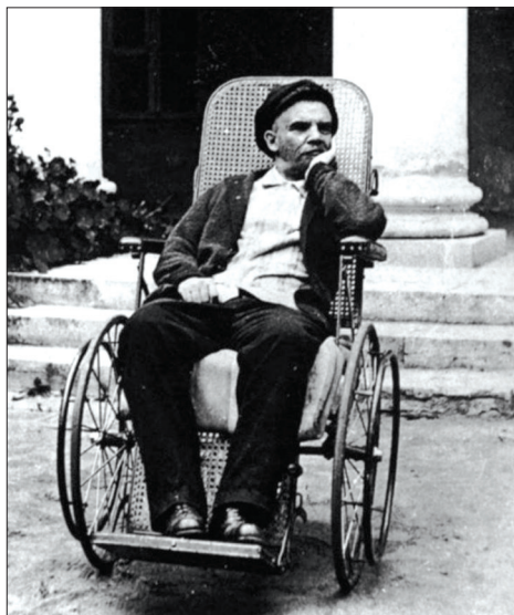
Vladimir Lenin, spisovateľ a mozog revolúcie, ktorý rád strieľal kňazov.

Lenin, otec diktátorskej literatúry, sa narodil ako Vladimir Il'jič Ulianov* v nekonečnej a nehostinnej ruskej pustatine. Jeho rodné mesto bolo bývalou pevnosťou, založenou storočie predtým ako bašta proti pohanským kmeňom žijúcim na okraji impéria. Teraz to však bolo zapadnuté miesto s kostolom, školami, továrňami a triedou miestnej šľachty, profitujúcej z práce nájomných farmárov.