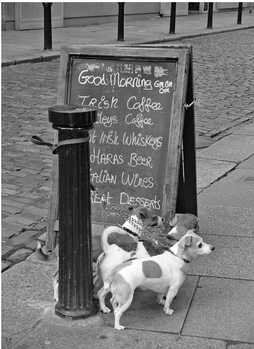
Pejsci na ranní procházce