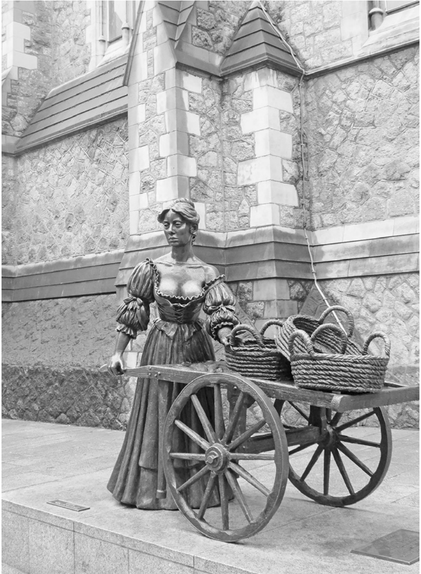
Socha Molly Malone v Dublinu, „buchtka s vozíkem“