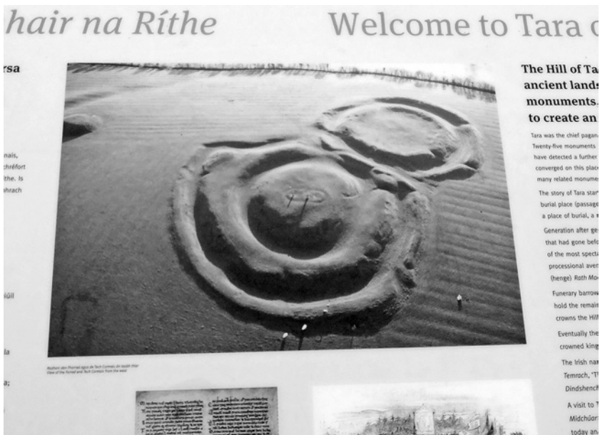
Letecký pohled na kopce Tara

Bylo to proto, že už neměl více bitev k boji a neměl další ženy k dobytí? Dobil už všechno – ochutnal i vína, i krve, i polibků – a tady stál