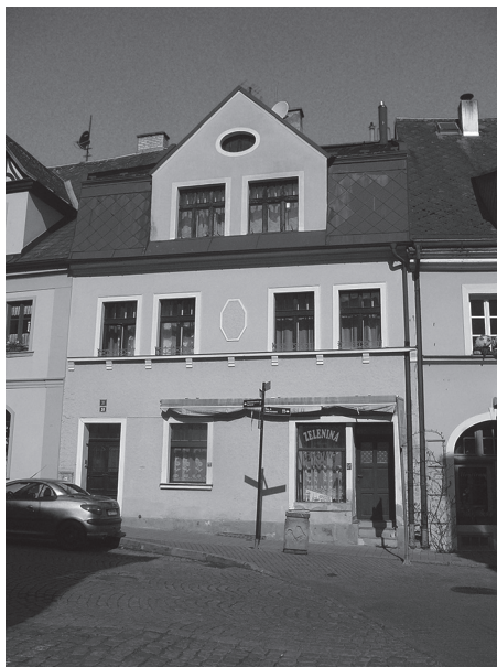
... a jeho současná podoba

dokonce na soud. Koncem roku 1931 (nebo na začátku roku následujícího) to Frank v Loktu „balí“ a vrací se do Karlových Varů. O udělení knihkupecké koncese ve svém rodném městě požádal už v roce 1929. Za tímto účelem mu starosta města Loket vydal „vysvědčení o chování“, kde mimo jiné „úředně potvrdil“, že „narozený 24. ledna 1898 v Karlových Varech, do Karlových Varů příslušný a od 8. 8. 1925 bydlící ve městě Loket Karl Hermann Frank, obchodník s knihami a uměním, byl během svého pobytu ve městě Loket v politickém, jakož i policejním směru nezávadný a jeho chování dosud bylo bezúhonné“.