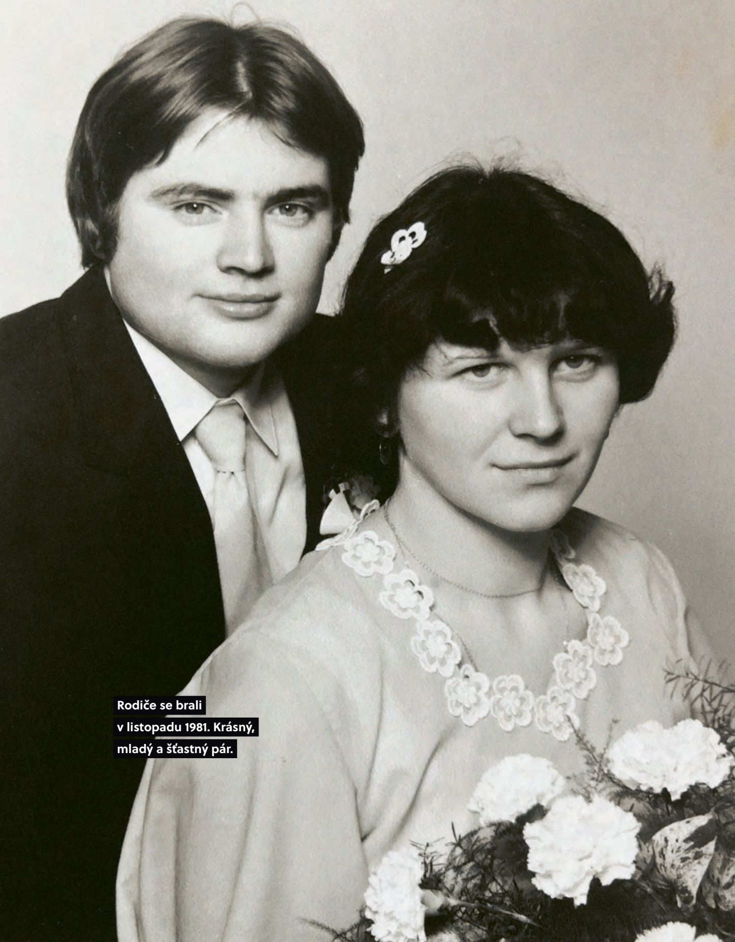
Rodiče se brali v listopadu 1981. Krásný, mladý a šťastný pár.