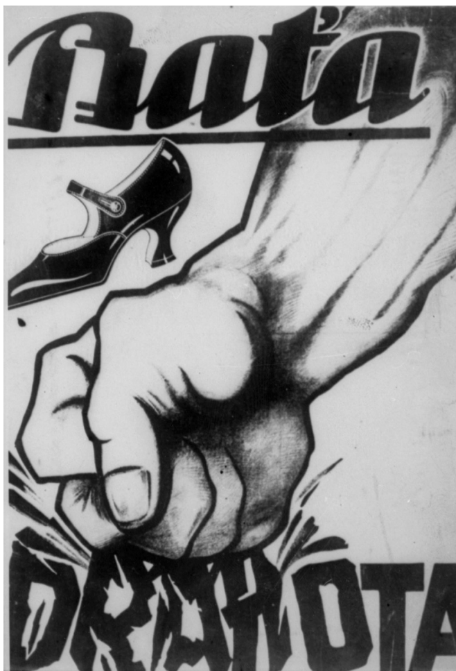
1922. Plakát, kterým firma Baťa oznámila zákazníkům snížení cen obuvi téměř o 50 % (Reklama Baťa, Moravský zemský archiv v Brně, Státní okresní archiv Zlín)