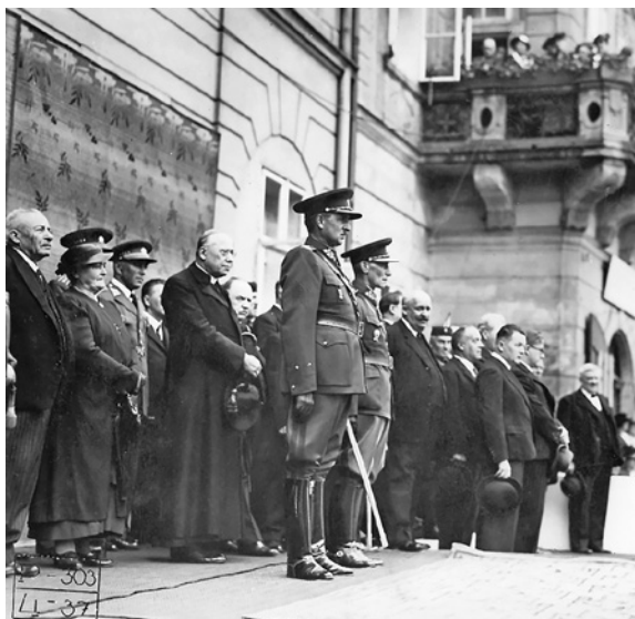
Královéhradecký biskup Mořic Pícha se 2. července 1937 účastní oslavy výročí dvacet let bitvy u Zborova.

existovala široká škála názorů a postojů od ztotožnění se s monarchií až po požadavek samostatného národního státu.