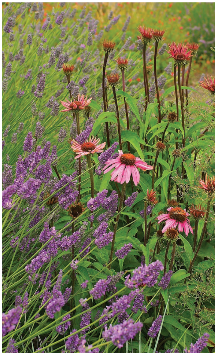
Levanduľa s echinaceou

Kvôli zrozumiteľnosti a jednoduchosti sme si zvykli používať domáce názvy jednotlivých druhov rastlín, aby sme nemuseli používať dlhé, ťažko vysloviteľné botanické názvy. Levanduľa sa stala obeťou tohto zvyku a termíny ako anglická, francúzska, španielska, či dokonca nemecká, sa bežne používajú na