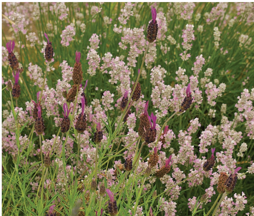
Lavandula stoechas ‘Portuguese giant’ vysadená spolu s L. angustifolia ‘Coconut Ice’.