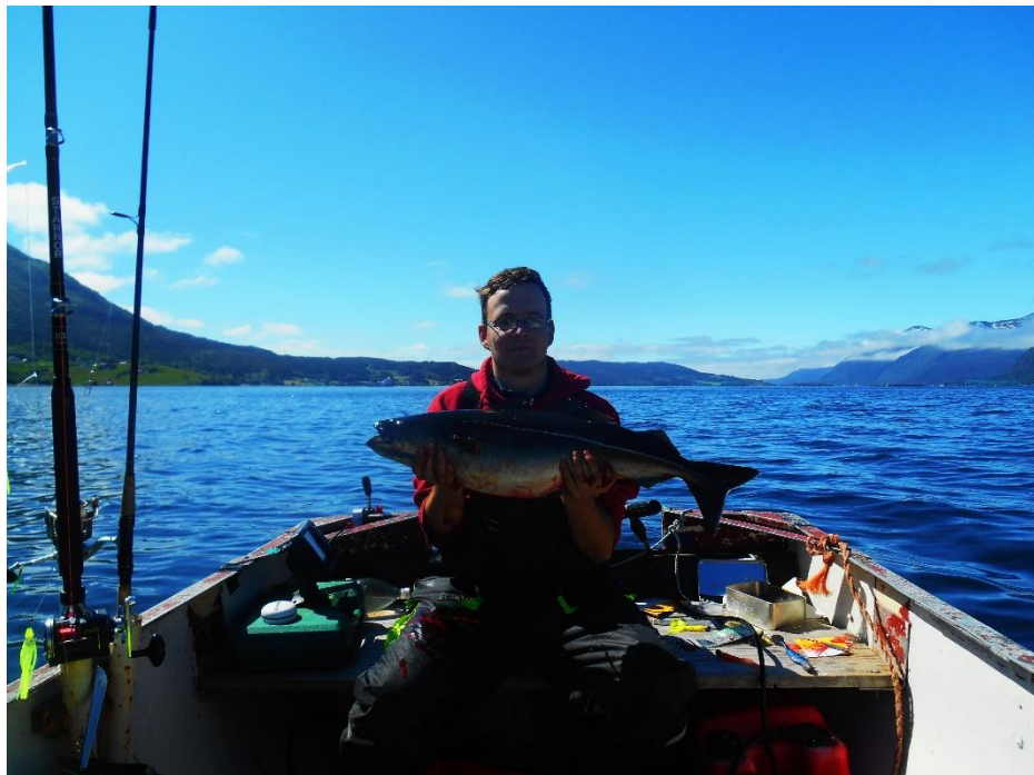
Moje maličkost a čerstvě ulovený Keller

Po příjezdu do kempu zůstávám jako opařený. Kemp byl opravdu pod mé očekávání. Můj pokoj ve mně vzbuzuje pocity, že žiju v krytu. Jedna místnost, jedna postel, malinký stoleček a dvě skříňky. Dochází mi, že odsud po šest měsíců není úniku, proto to musím přežít. Kvůli tomu si hned první den nepodřežu žíly.