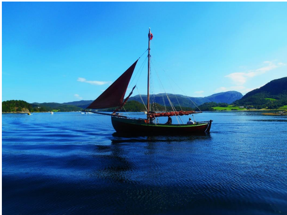
Jedna z předváděcích lodí na závodech Dračích lodí

Po pár týdnech se smíruji s faktem, že z kempu se dostanu až na konci sezony. Začínám přicházet některým věcem na chuť. Kupříkladu poměrně úspěšně opravuji lodní motory. Uznávám, že mi to ze začátku moc nešlo.