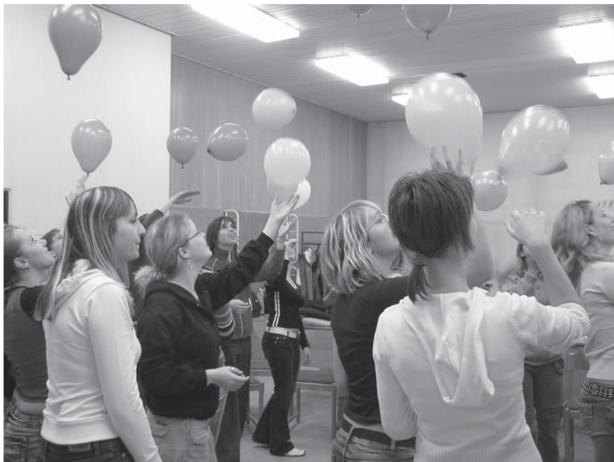
Obr. 1 Balonky jako symbol pro narůstající množství informací. Výuka globální výchovy na Technické univerzitě v Liberci, 2006.

V následujícím textu bude důraz kladen na teoretické rámce pro dialogické využívání her, tedy takové, ve které jde o dialog, změnu horizontu druhého, v určitém slova smyslu o transformaci jeho způsobu porozumění světa. Teoretickým rámcům, jejichž cílem je využít hry pro přenos dat, transmisi , bude věnován prostor menší, vždy v poslední části každé kapitoly. Důvodem je i stále převládající transmisivní charakter českého školství – a autorovo přání změnit jej na školství transformativní.