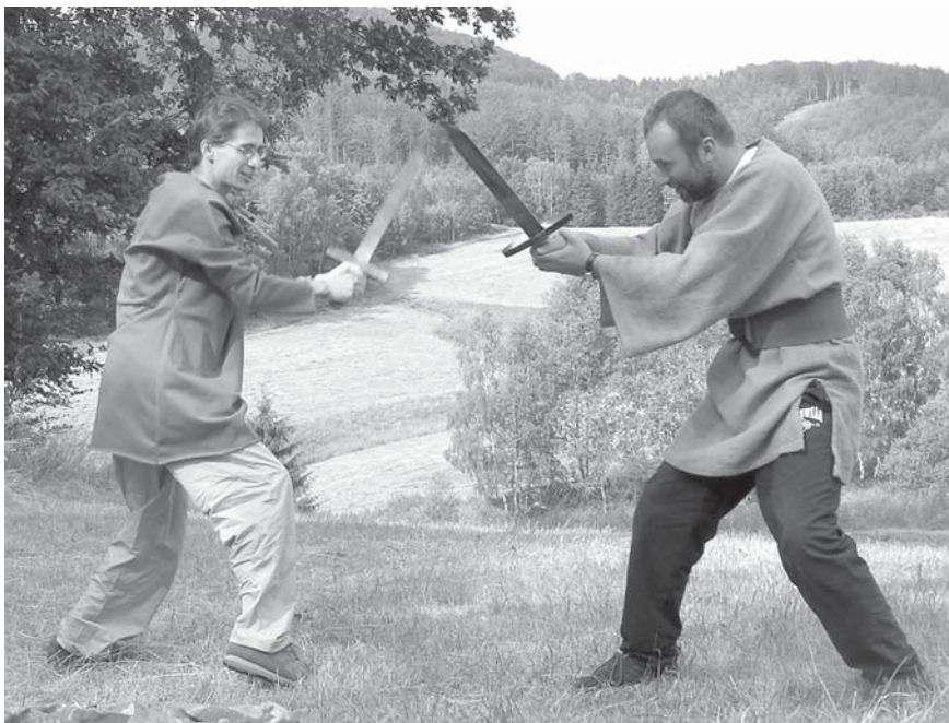
Obr. 4 K překonání komfortní zóny jsou účastníci motivováni pomocí scének a kostýmů. Kurz globální výchovy, 2005.