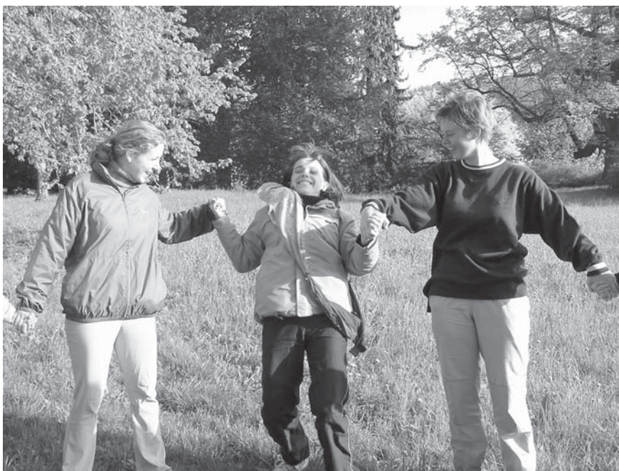
Obr. 3 Icebreakery. Výuka environmentální výchovy na Technické univerzitě v Liberci, 2002.

S tím na druhé straně polemizuje Colliersová. Podle jejího názoru může být naprosté ponoření pro studenty kontraproduktivní, neboť jim může bránit v následné kritické reflexi hry. [21] Učitel proto musí svým přístupem opatrně balancovat na hranici ponoření a odstupu. V některých případech může být důležité trochu zmírnit zaujetí hráčů, odlehčit napětí – a současně nevypadnout z role.