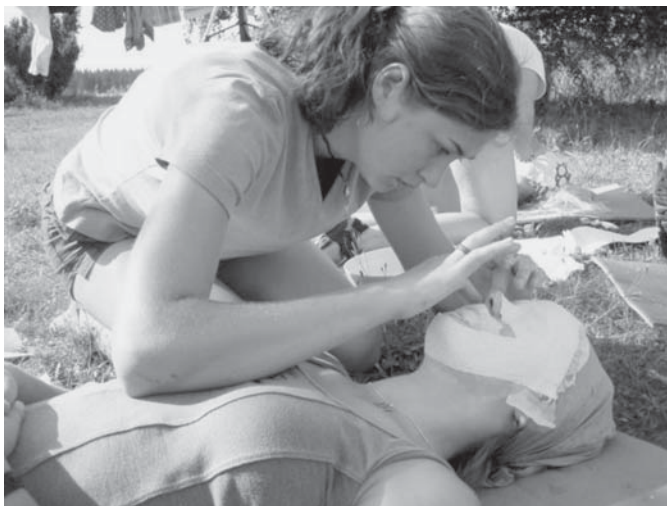
Obr. 2 Výroba masek jako aktivita na budování důvěry ve skupině. Kurz volným pádem, 2003.

V následujícím textu budou tyto principy postupně analyzovány.