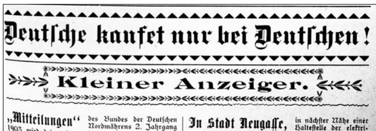
Obr. 11: „Němci, kupujte jen u Němců“ – záhlaví z reklamní části Mitteilungen des Bundes der Deutschen Nordmährens

Hospodářským centrem monarchie se tehdy stávala Vídeň v mnohem větším rozsahu v porovnání s tím, jak tomu bylo dříve. Její klíčovou hospodářskou roli podporovala též skutečnost, že byla s ostatními hospodářskými centry monarchie postupně propojována vznikající železniční sítí, a že se v ní rozhodovalo o investicích, jež měly zásadní hospodářský význam. Tyto okolnosti spolu s jinými pak způsobily, že koncept českého patriotického kapitalismu přestal být pro jeho předrevoluční zastánce atraktivní. České národní hnutí bylo ochromeno porážkou předchozí revoluce do té míry, že se s oživením jeho společenských iniciativ setkáváme až na konci 50. let 19. století. Jeho přívrženci nebyli v tomto desetiletí kapitálově tak silní a mentálně připravení, aby se mohli vydat podobnou cestou jako velcí investoři. Přitom se však zdá, že hospodářské oživení, jež s sebou porevoluční doba přinesla, poskytlo i části českých středních vrstev jisté zisky, což se potom společně s dokončeným výkupem z poddanství projevilo v 60. letech 19. století. 14