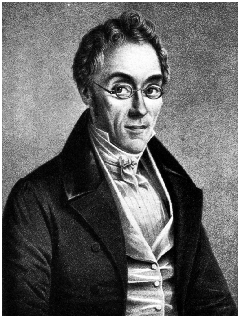
Obr. 7: Friedrich List