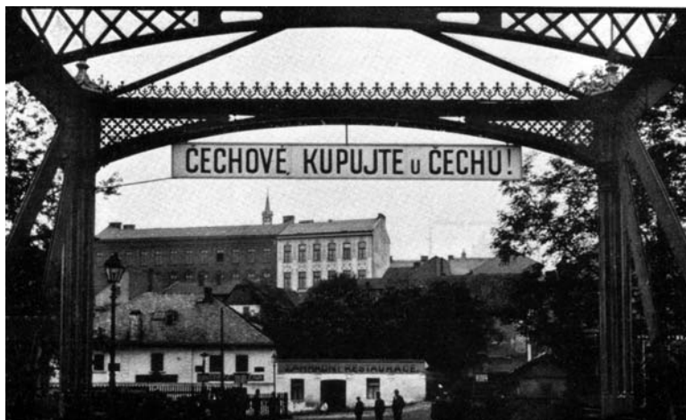
Obr. 6: Česká nacionální agitace v Kolíně (počátek 20. století)

Rozdíly ve strategiích hospodářského nacionalismu spočívaly v našem případě v tom, zda jednotlivé národy habsburské monarchie mohly k jeho prosazování využívat státní moc, či se na ni mohly spolehnout jen příležitostně nebo pouze v malé míře, jako tomu bylo zejména u českých politických a podnikatelských elit před první světovou válkou, či k ní neměly žádný efektivní přístup, jako tomu bylo v Předlitavsku ve stejné době např. u Rusínů a v Uhersku např. u Slováků. Další rozdíl pak spočíval v tom, zda měl hospodářský nacionalismus ekonomicky propojovat národy, jež nežily pouze na území habsburské monarchie, což platilo zvláště pro Rumuny a Italy, do jisté míry pro rakouské a české Němce a svým způsobem i pro Srby. Příslušníci těchto národů totiž mohli upírat svoji pozornost k příslušným národním státům