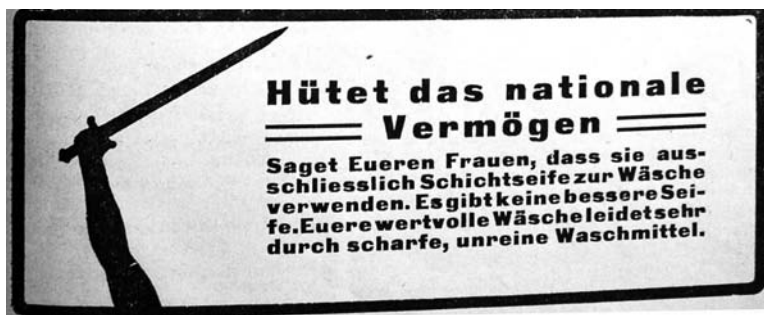
Obr. 5: „Chraňte národní majetek. Řekněte svým ženám, aby používaly na praní výlučně Schichtovo mýdlo“

V těchto zásadách, jež byly ovšem velmi obtížně vzájemně slučitelné tam, kde si tímto způsobem počínalo stále více národů či států, lze po mém soudu spatřovat výchozí ideálně-typickou konstrukci moderního hospodářského nacionalismu nejen v multietnickém prostředí českých zemí, nýbrž i jinde. Jeho ideálním cílem bylo uzavření vlastního trhu pro výrobky, které umělo dané národní hospodářství aktuálně nebo potenciálně vyprodukovat na straně jedné a souběžná snaha o vývoz na cizí trhy na straně druhé. Vývozu se z hlediska zastánců hospodářského nacionalismu rovněž typologicky blížila situace, když si Čech v Čechách koupil „německý“ výrobek a vice versa, který tak byl vlastně exportován do „cizí-