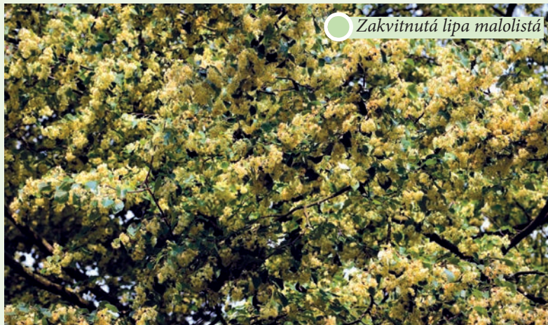
Zakvitnutá lipa malolistá