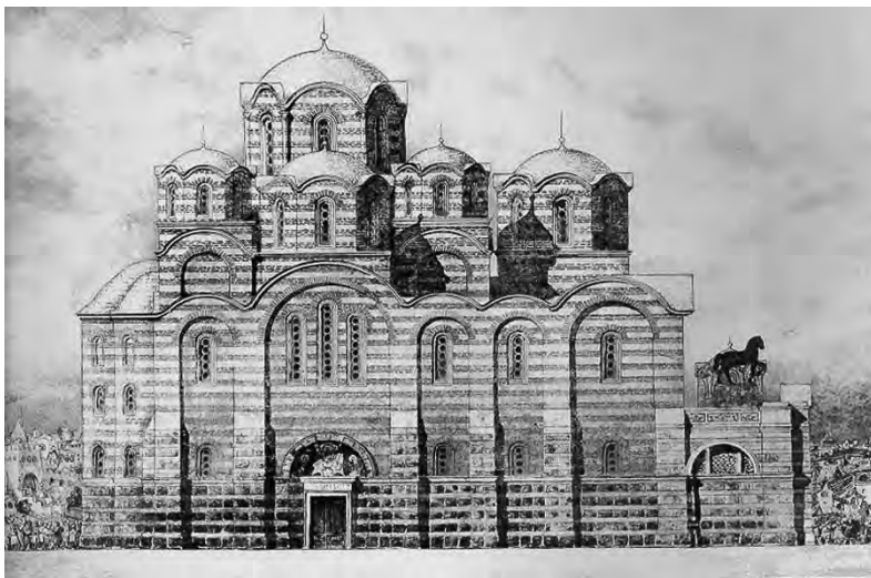
Chrám Sv. Sofie v Novgorodě. Postaven v letech 1045-1050, jeden z nejstarších dochovaných chrámů na území Ruska.

Kníže Vladimírko Volodarevič z větve Rostislavičů (potomků Rostislava, vnuka kyjevského knížete Jaroslava Moudrého) spojil jednotlivá knížectví západně od Kyjeva v knížectví haličské; usiloval též o Volyn.