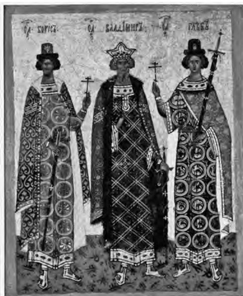
Sv. Vladimír se syny Borisem a Glebem. Ikona novgorodské školy z 15. století.

Vladimír poslal dalšího syna Borise proti Pečeněhům, kteří ohrožovali knížectví již řadu desetiletí a které se Vladimírovi nepodařilo podrobit, a sám se vypravil proti Nov-