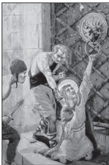
VRAŽDA VÁCLAVA BOLESLAVEM