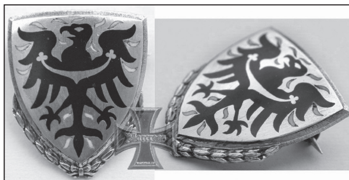
SYMBOL VYZNAMENÁNÍ PROTEKTORÁTU