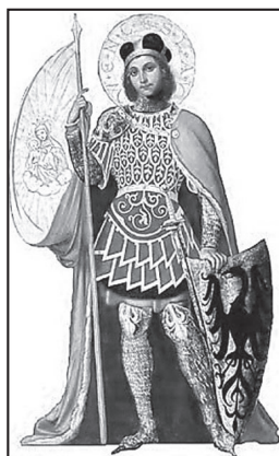
SYMBOL SVATÝ VÁCLAV