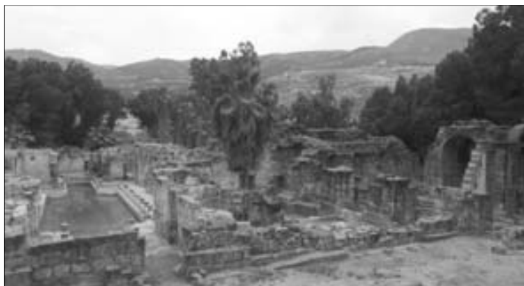
Obr. 1.1 Antické vykopávky v Tiberias-Hammat ( https://touristinisrael.wordpress.com/2016/08/21/tiberias-hammat-hot-springs/#jp-carousel-5129 )

Historie Jeruzaléma je delší než 6000 let. Koupel v Jordánu už v době předkřesťanské měla očistný a léčivý význam. Budovány byly umělé rybníky a skalní cisterny. Palestinci využívali v té době termální vody u jezera Tiberias (obr. 1.1) a později také Římané.