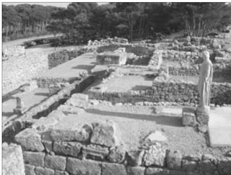
Obr. 1.2 Nejstarší nemocnice světa Asklepieion ( https://www.google.cz/search?q=asklepieion&source=lnms&tbm=isch&sa=X&ved=0ahUKEwjEr76r1OzZAhUTiaYKHdAdCzAQ_AUICigB&biw=1920&bih=954#imgdii=2fvCK6v7XbPsmM:&imgsrc=m-DoNztnyRMoJzM )

Kulturu vodoléčby převzaly antické civilizace, Řekové a Římané. Jejím propagátorem byl Hippokratés z Kósu (460–377 př. n. l.). Hippokratés pocházel z jižních Sporad, z ostrovů při jihozápadním pobřeží Malé Asie, z lékařské rodiny, odvozující svůj původ od Asklépia, řeckého léčitele, který měl žít ve 13. století př. n. l. Hippokratés inicioval systém léčení vycházející z mnohaletých zkušeností, ale přizpůsobený novým poznatkům. Navrhl nejstarší nemocnici světa Asklepieion (obr. 1.2). Řekové milovali polévání a sprchování. Znali parní a horkovzdušné lázně. V bohatých domech bylo zvykem nabídnout návštěvníkovi lázeň a poté byl natírán vonnými oleji. Pro nejbohatší byly zakládány i lázně.