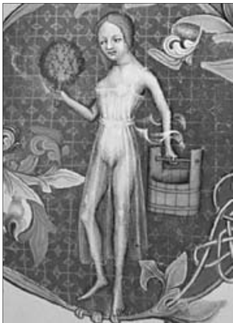
Obr. 1.4 Lazebnice z bible Václava IV.

že v té době neexistovala žádná ostýchavost, společně se koupali muži, ženy a děti, chudí i bohatí. S rozvojem balneoterapie se rozvíjí dietetika, pochopitelně v jiném pojetí, než ji přijímáme dnes.