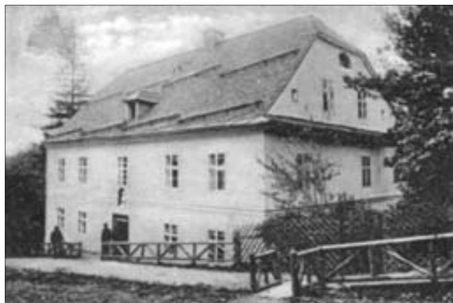
Obr. 1.7 Priessnitzův vodoléčebný ústav

Priessnitz se pochopitelně dostával do konfliktu s místními lékaři a ranhojiči, kteří na něj podali stížnost. Vadilo jim, že laik léčí zadarmo a úspěšně. Priessnitzovi byl časem povolen provoz malého lázeňského zařízení se dvěma vanami, které smělo hostit pouze místní obyvatelé, a to pod dohledem lékařů. Oficiální lázně vznikly v roce 1837, kdy získal potvrzení císařské komise, ačkoliv neměl lékařské vzdělání. Komise prohlásila jeho vodoléčbu za „nový pozoruhodný jev v oblasti zdravotnictví“. V lázních se tou dobou léčilo až 1500 pacientů ročně a sjížděli se sem lékaři z celé Evropy, aby studovali Priessnitzovy léčebné metody.