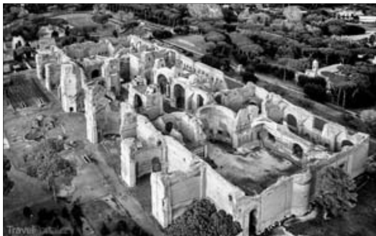
Obr. 1.3 Caracallový lázně

revolucí byl vynález centrálního topení v 80. roce př. n. l. To umožňovalo rozvoj lázní v dobytých koloniích s chladnějším podnebím (např. Trevír v Německu). V době největšího rozkvětu bylo v Římě minimálně 13 velkých veřejných a na 800 soukromých lázní, mnohé se těšily nebývalému luxusu (obr. 1.3). Lázně nebyly jen místem očisty, ale znamenaly společenské centrum s dosahem do politického a obchodního života. Většina vnitřních interiérů byla obložena mramorem, kamenné vany byly z jediného kusu nerostu. Svobodný Říman mohl strávit v lázních celý den. Nacházely se v nich různé obchody, návštěvníci měli k dispozici baziliku či knihovny. Sloužily i k sexuálním hrátkám.