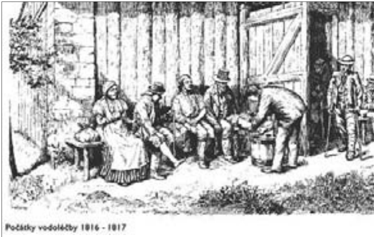
Obr. 1.5 Počátky léčby v Gräfenberku ( https://www.taringa.net/posts/salud-bienestar/9264947/Vincenz-Priessnitz-fundador-de-la-hidroterapia.html )

splašenými koňmi. Priessnitz se vyléčil sám pomocí studených obkladů a vody, zlomená žebra si rovnal o opěradlo židle. Tento úspěch ho přivedl k nápadu léčit zvířata sousedů a později samotné sousedy. Pověst o jeho schopnostech se rozšířila tak, že začali přicházet i významné osobnosti nejen ze Slezska, ale z celého Rakouského mocnářství (obr. 1.5). V roce 1822 přestavěl rodný dům ve zděnou budovu s patrem (obr. 1.6). V přízemí umístil necky, a tak vznikl první vodoléčebný ústav na světě (obr. 1.7). Kromě využívání studené vody k zábalům, omývání a koupání využíval potní kůru a pracovní terapii.