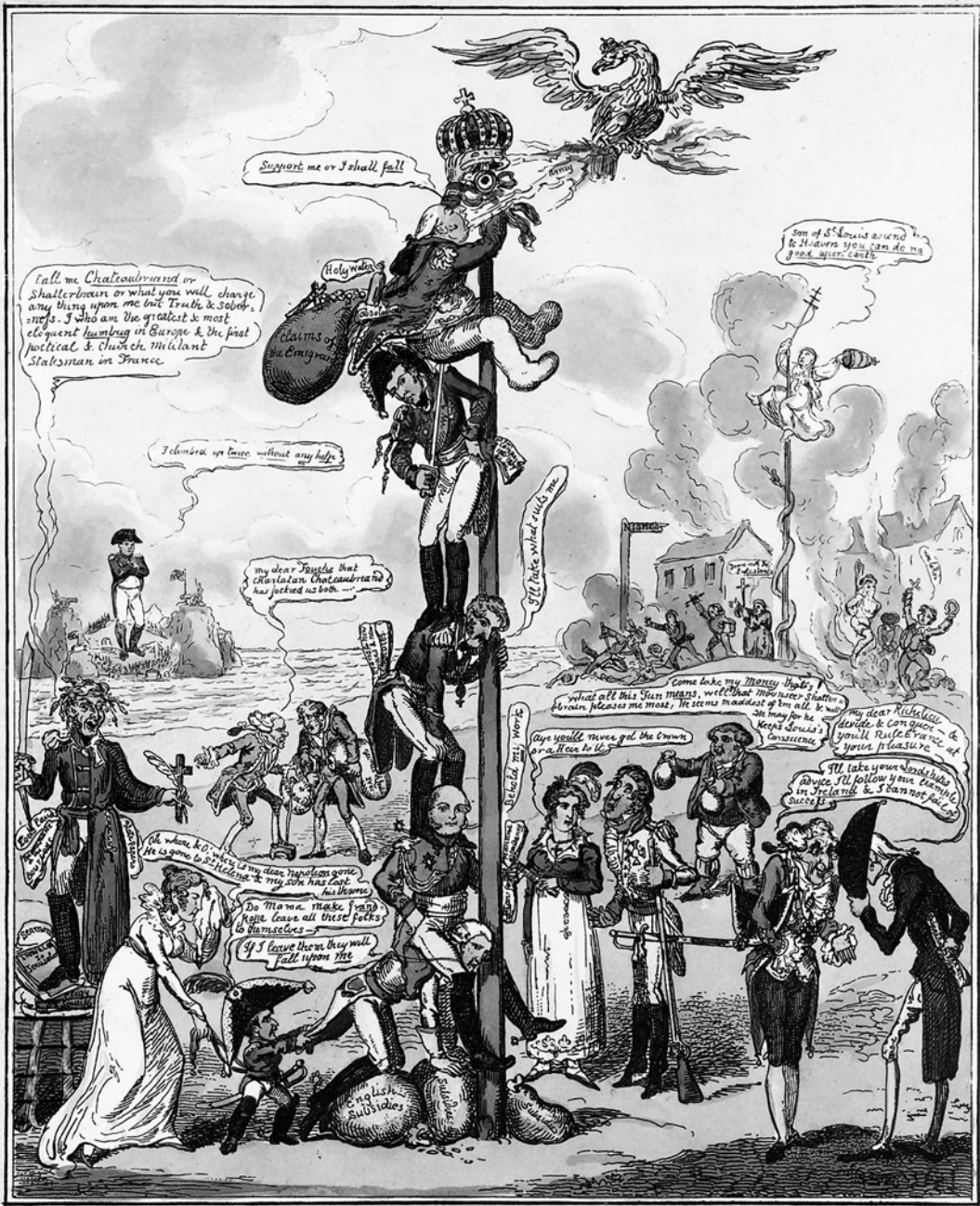
Během kongresu mocností ve Vídni slavila hotově žně politická satira a karikatura. Zde na samém vrcholu tyče vidíme francouzského krále Ludvíka XVIII., kterák spledá pro svou korunu, zespona podepírán anglickým zplnomocněncem Wellingtonem, pruským králem Friedrichem Vilémem III., carem Alexandrem I. a nakonec rakouským císařem Františkem I., který klečí na pytlích peněz symbolizujících britské subsidie. Scénu pak doplňuje například Napoleon v exilu, Marie Luísa s malým Napoleonem či četní francouzští politici včetně Fouchého a Talleyranda.