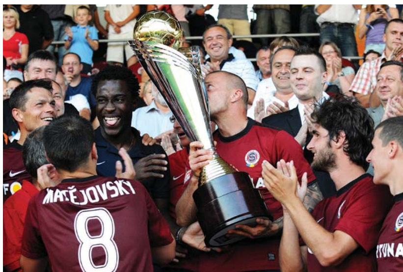
(Super)pohár jsem políbil, ale...

První nepříjemnost přišla hned v prvním soutěžním utkání sezony 2010/2011, byť vlastně patřilo ještě do té předcházející. Ve vůbec prvním českém Superpoháru jsme si to v červenci 2010 rozdali s tehdy už dost sebevědomou Plzní. Já dostal hned zkraje zápasu po faulu