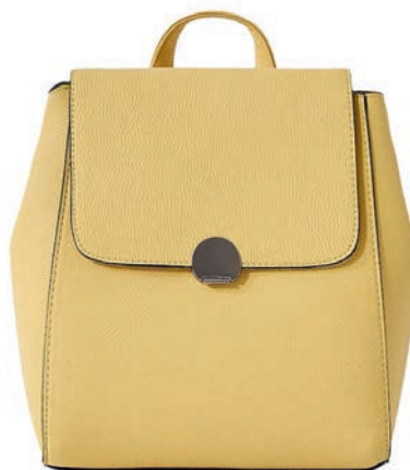
Ruksak, Stradivarius, 15,99 €