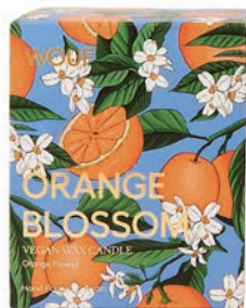
Vonná sviečka Orange Blossom, Westwing, 39 €