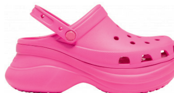
Topánky CROCS CLASSIC BAE CLOG W, 59,99 € na urbanlux.sk