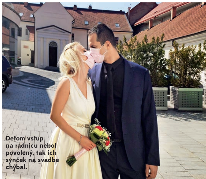
Deťom vstup na radnicu nebol povolený, tak ich synček na svadbe chýbal.

Aj samotný obrad na radnici v Trnave prebiehal neštandardne a nie celkom podľa predstáv. „Oddávala nás viceprimátorka. Prítomná bola aj matrikárka, my, svedkovia, a to bolo všetko. Obrad bol