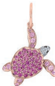
Náušnice, ALO diamonds, info o cene u predajcu