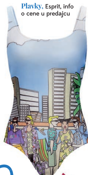
Plavky, Esprit, info o cene u predajcu