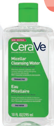
Micelárna voda, CeraVe, 9 €