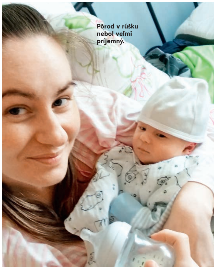
Pôrod v rúsku nebol veľmi príjemný.