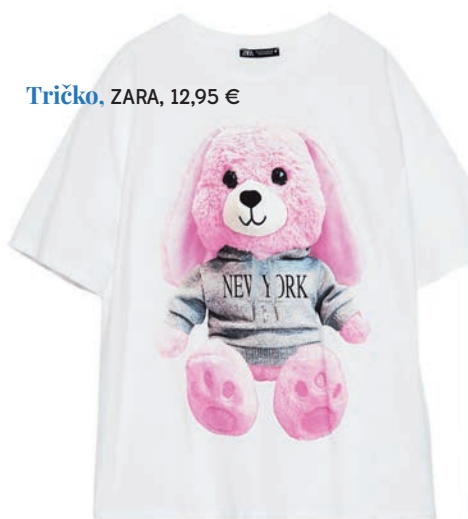
Tričko, ZARA, 12,95 €