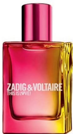
Toaletná voda ZADIG & VOLTAIRE THIS IS LOVE! 50 ml za 77,50 € na mariounnaud.sk