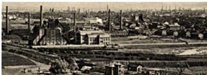
Průmyslová Ostrava dvacátých let minulého století

Myšlenky na sloučení ostravských obcí, které již před první světovou válkou tvořily téměř jednotný celek se stále častěji objevovaly na jednáních městských výborů a z podnětu J. Prokeše byla 15. 4. 1919 svolána schůze zástupců všech ostravských obcí a měst, které by se měly podílet na vytvoření Velké Ostravy. S návrhem ovšem nesouhlasila část zástupců slezských obcí a projekt byl na čas smeten. Teprve výnos ministerstva vnitra z 10. října 1923 vyhlašuje úmysl sloučit obce Moravskou Ostravu, Přívoz, Vítkovice, Mariánské Hory, Zábřeh nad Ostravicí, Novou Ves a Hrabůvku do jedné obce pod názvem Moravská Ostrava. Sloučení obcí bylo povoleno od 1. ledna 1924 a Moravská Ostrava tak měla nyní rozlohu 4029 hektarů a 113 709 obyvatel.