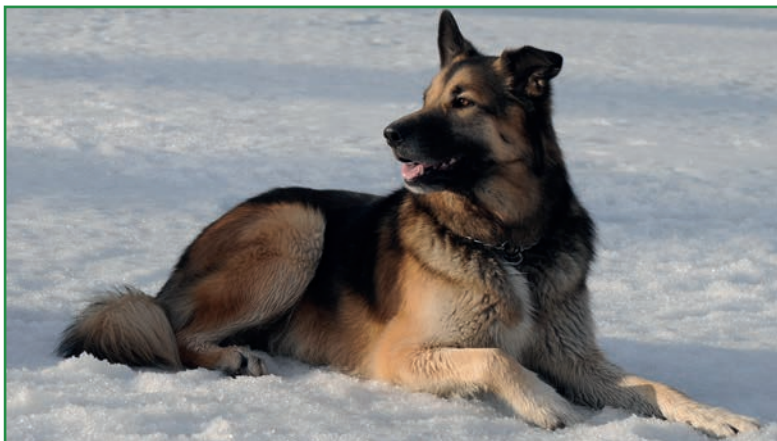
„Psia policajtká“ Oxy – Gordonova nová kamoška

„Ahoj, maličký – ja nie som Derick, ani ho nepoznám. Len včera som sa sem so svojou paničkou pristahovala. Ja som,“ vypla hrud', pyšne zdvihla hlavu, uši rovno postavila a vznešene povedala, „volám sa Oxy a som belgická ovčička!“ Vtedy k nám prišiel aj Jarko s Backou. S dvojnoháčkou, ktorá má sučku s takým zvláštnym menom, sa pozdravili a začali sa rozprávať. Neviem, o čom sa spolu rozprávali, lebo som práve obiehal šípkový kríček, chvostom som z neho ometal sneh a celý rozradostený som svojím štekaním dával novej kamoš-