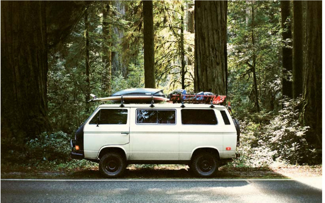
Nahoře: Big Sur, Kalifornie; dole: Humboldt County, Kalifornie