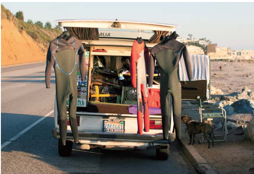
Předchozí strana: Humboldt County, Kalifornie; nahoře: Malibu, Kalifornie

Moje sny a vzpomínky ostře kontrastovaly s narůstající jednotvárností mého „dospělého“ života na Manhattanu. Každý den v osm ráno jsem jel do práce v centru města. U svého pracovního stolu jsem si dal dvacetiminutovou snídani a zřídka kdy se vrátil domů před osmou večer. Našel jsem práci svých snů a rychle si klestil cestu k zajištěnému, pohodlnému a předvídatelnému životu – tak, jak tomu moji generaci učili od raného věku. Mým vrstevníkům to připadalo jako správná cesta, ale já bojoval s rostoucím pocitem, že nežiju v souladu s tím, co od života očekávám. S těmihle všemi pocity a snem o dodávce, jenž mě poháněl kupředu, jsem začal plánovat svůj útěk z New Yorku. Shodou okolností v té době vzbudil trochu pozornosti můj fotografický projekt Hořící dům ( The Burning House ), který byl nakonec vybrán k publikování. Přidal jsem zálohu na knihu k ostatním penězům, co jsem si naškudlil, a s opět probuzeným pocitem naléhavosti začal shánět dodávku.