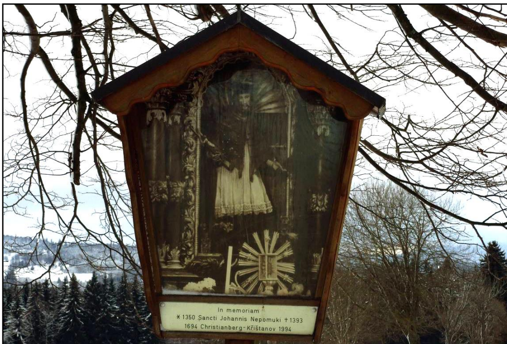
Sakrální drobnosti bývalých Sudet na popsané trase