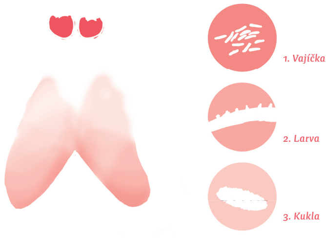
Obr. 1. Moucha domáca

Aj to si musí pevné jedlo najskôr nasliniť alebo ogrc... ble. Takže dostávala ješť hlavne niečo mäkké. Alebo tekuté. Omáčky a tak.