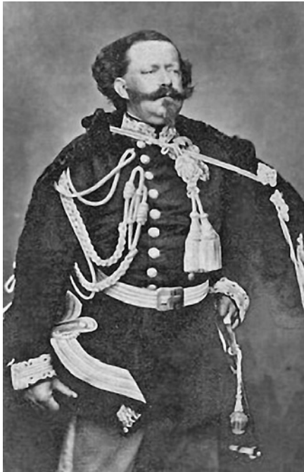
Viktor Emanuel II.

obyvatelé severní části Südtirol mluvili německy a smýšleli rakousky, jejich jižní sousedé z Trentina (Tridentska) hovořili italsky a stejně jako Benátčané tajně věřili, že se jednou probudí jako Italové, jak jim Viktor Emanuel opakovaně sliboval.