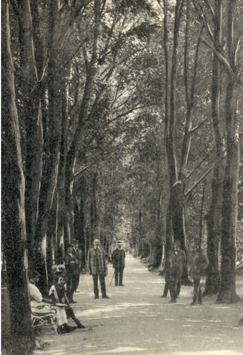
Turčianske Teplice na začiatku 20. storočia

Socialistická funkcionalistická architektúra často necitlivo a bez vkusu prevälcovala noblesný ráz kúpeľov a jej dôsledky sú viditeľné dodnes v komplexoch liečebných domov v Piešťanoch, Dudinciach, Trenčianskych Tepliciach, Vyšných Ružbachoch, Turčianskych Tepliciach, Bardejovských Kúpeľoch. V roku 1967 vznikol štátny podnik Slovakotherma, generálne riaditeľstvo kúpeľov, ktorý mal na starosti rozvoj kúpeľov, podporu vedy a výskumu aj ich propagáciu v zahraničí.