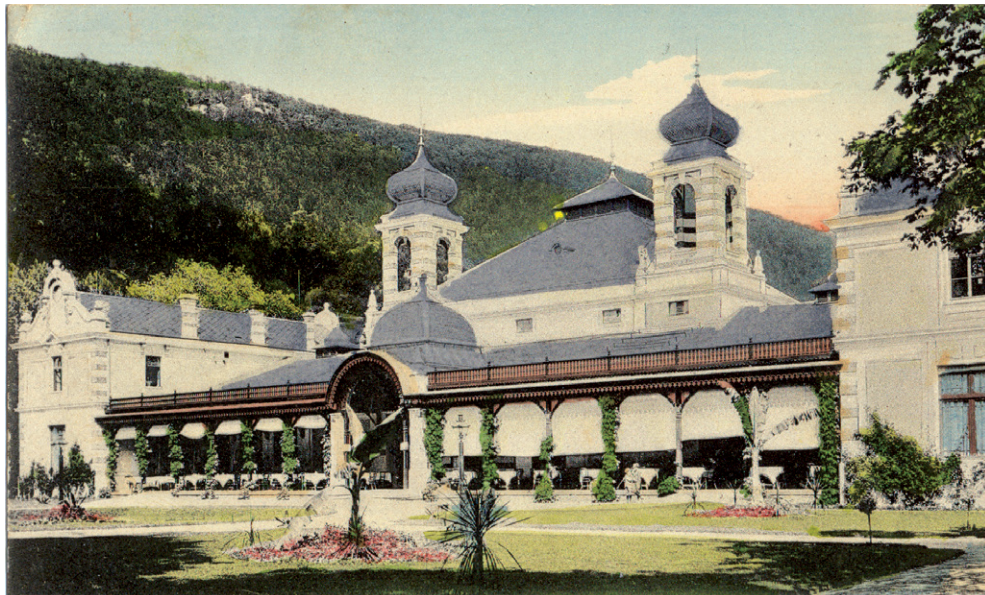
Trenčianske Teplice na začiatku 20. storočia

hudobní skladatelia, operní speváci, spisovatelia a vedci. Slovenské kúpele navštevovala a navštevuje skutočná spoločenská elita.