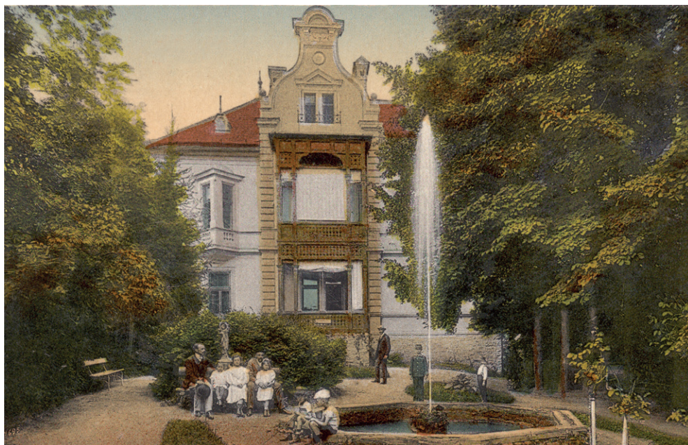
Bardejovské Kúpele na začiatku 20. storočia

Kúpele majú svoju dôstojnú a slávnú históriu, veď aké slovenské mestá sa môžu pochváliť toľkými návštevníkmi s modrou krvou, ak nie práve tie kúpeľné? Cisári a cisárovné, maharadžovia i prezidenti, nositelia Nobelovej ceny, najvýznamnejší