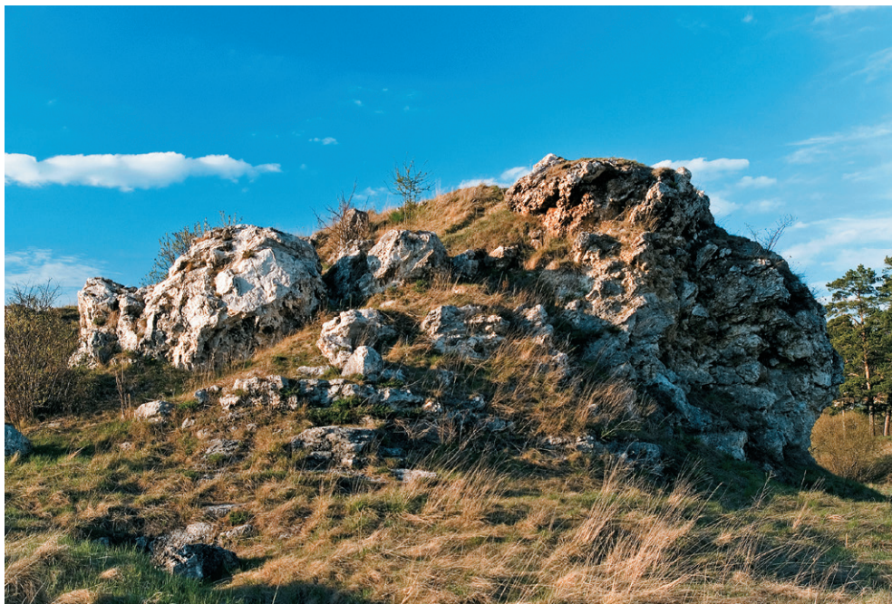
Travertínová kopa v Gánovciach