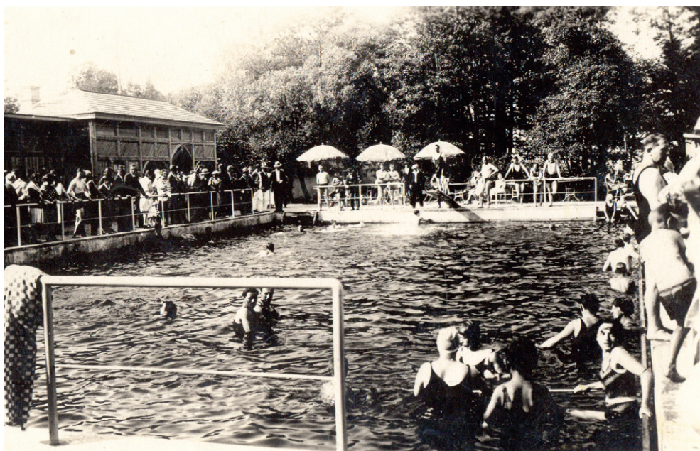
Bazén v Turčianskych Tepličiach v prvej polovici 20. storočia

Dnes je balneológia vedný odbor, ktorý sa zaoberá pôsobením prírodných liečivých zdrojov, teda prirodzene sa vyskytujúcich minerálnych vôd, plynov, peloidov (to sú