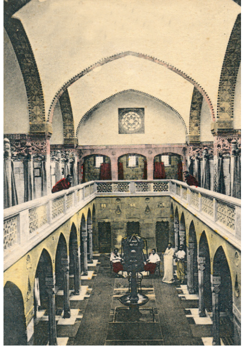
Odpočívareň Hammam v Trenčianskych Tepliciach

V hĺbkach sa nachádzajú aj bývalé „moria“, teda vody, ktoré boli uzavreté pri tektonických pohyboch zemských dosiek, alebo vody zozbierané z povrchových vôd v rozsiahlych pásmach podzemných dutín a priepustných vrstiev. Súčasťou týchto podzemných pohybov vody, ale aj hornín a magmy, sú tiež plyny, ktoré sú často