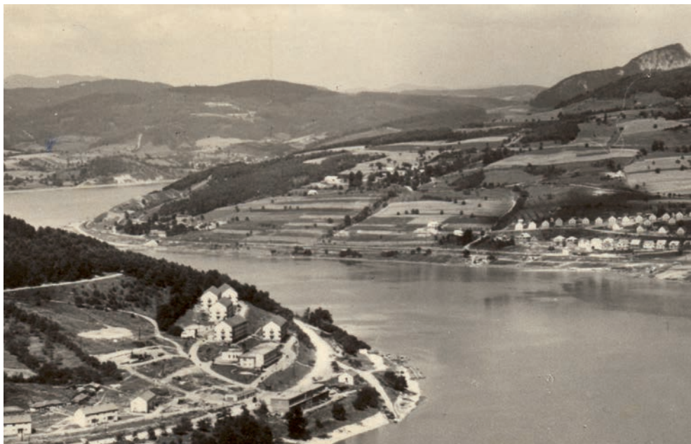
Nimnica v druhej polovici 20. storočia

priaznivých pre klimatoterapiu. „Štát československý stal sa majiteľom početných liečivých prameňov a patrí z tejto stránky medzi najbohatšie štáty vôbec,“ píše sa vo vyhlásení ustanovenej Balneologickej spoločnosti československej, pričom záštitu nad prvým balneologickým kongresom prevzal vtedajší minister verejného zdravotníctva a telesnej výchovy Dr. Vavro Šrobár.