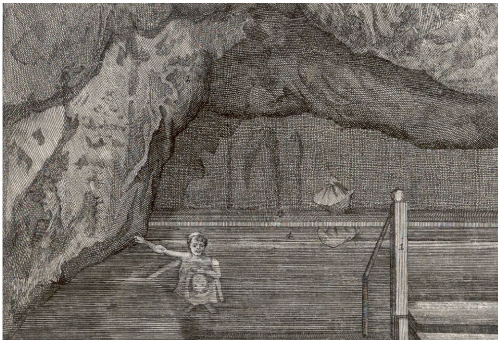
Kúpeľ Parenica v Sklených Tepliciach v 18. storočí

Termálne pramene a prístupné pramene vôd vôbec sa však stávali súčasťou záujmu bohatých vrátane cirkvi a kráľovských