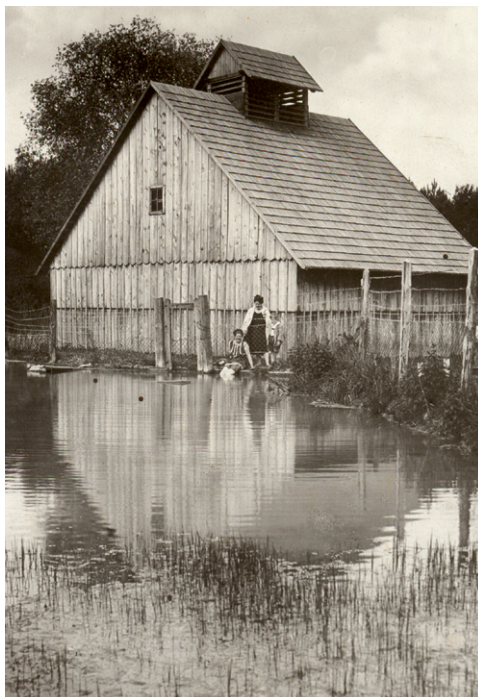
Jazero v Bojniciach s liečivým bahnom

vždy dlhšie trvajúcim pôsobením prostredia a prírodných liečivých zdrojov na celý organizmus človeka, čiže je v nej implicitne obsiahnuté aj poznanie, že človek potrebuje okrem kúpeľných procedúr aj oddych a spomalenie. Už na začiatku 20. storočia sa pri pobyte v kúpeľoch ordinovali aj procedúry fyzikálnej medicíny a diétne opatrenia. Československo bolo priekopníkom práve v oblasti fyzikálnej medicíny, ktorá využíva v liečbe fyzikálne podnety. V súčasnosti je kúpeľná starostlivosť komplexnou zdravotnou starostlivosťou s využívaním nielen prírodných liečivých zdrojov, ale aj fyzikálnych podnetov, dietoterapie, psychologickej intervencie, metodík pohybovej liečby a, samozrejme, liečebnej výchovy.