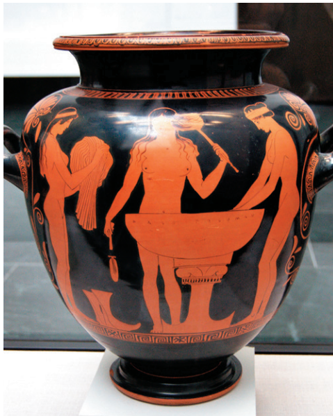
Zobrazenie kúpeľa na starogréckej keramike

Samotné kúpele vnímali a predpisovali lekári staroveku ako príjemný, uvoľňujúci, relaxačný spôsob liečby. Aj sám Hippokrates, na ktorého dielo prisahajú lekári dodnes, kúpele odporúča. Vo svojich spisoch sa odvoláva na prirodzenú silu prírody a v nej aj vody. V knihe O životospráve odporúča pre harmonický a zdravý život pravidelné telesné cvičenia, sex, kúpele a spánok. Okrem toho skúmal aj účinky vody a jej teploty na pulz a popísal prvé vodoliečebné a rehabilitačné procedúry.