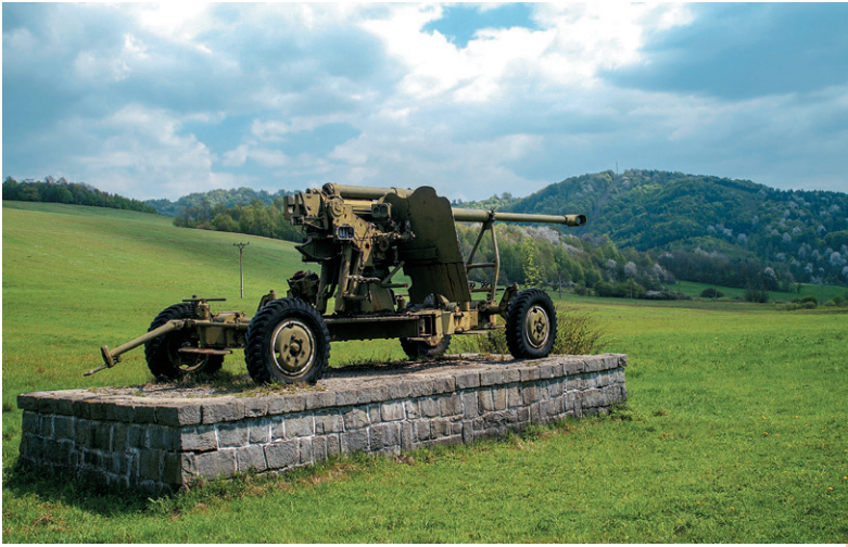
Bojová technika z druhej svetovej vojny v okolí Kalinova

a najmä oneskorená. V období komunistickej totality rusínsky národ vlastne vôbec nejestvoval, oficiálne tu boli iba Ukrajinci. Štátna moc Rusinom siahla nielen na národnú identitu, ale im násilne vstúpila do ich duchovného života. Úradným zákazom gréckokatolíckej cirkvi muselo mnoho rusínskych veriacich prestúpiť na štátom akceptované pravoslávie. Po roku 1989 sa odštartoval obrodenecký proces Rusínov s vytvorením všetkých základných atribútov, ktoré musí mať každý svojbytný národ. Podarilo sa kodifikovať rusínsky spisovný jazyk a slobodne rozvíjať národnú kultúru. Nevyriešeným problémom však zostáva pretrvávajúca rozpoltenosť rusínsko-ukrajinského etnika na Slovensku.