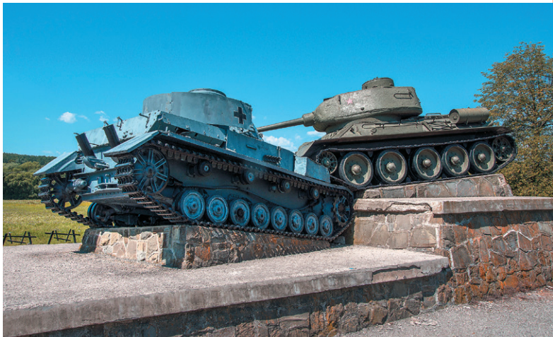
Pamätník pred vstupom do Údolia smrti

Väčšina hrobov prvého vojenského cintorína, ktorý je súčasťou obecného cintorína v Beňadikovciach, vznikla až po vojne. K pôvodným trom hrobom pribudlo ďalších osem pre vojakov z ôsmich exhumovaných hrobov nájdených v okolí dediny. V 12 hroboch je celkom 14 padlých vojakov, dvaja z nich bojovali pod zástavou cárskeho Ruska, zvyšní boli z opačného tábora, z rakúsko-uhorskej armády. Len u šiestich vojakov sa podarilo zistiť ich identitu, vo všetkých prípadoch chýbajú údaje o mieste a dátume smrti. V chotári obce sa nachádza ešte jeden vojenský cintorín s jedným masovým hrobom, v ktorom je pochovaných deväť ruských vojakov neznámej identity.