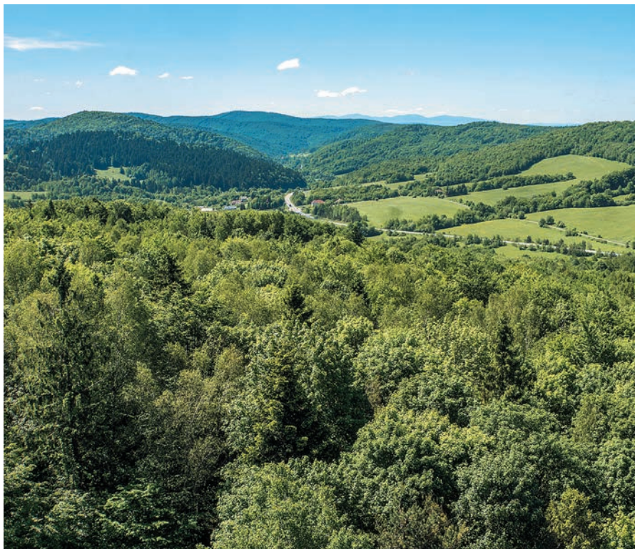
Duklianske bojisko z vyhliadkovej veže

ník leží na šarišskej a Stropkov na zemplínskej strane. Tento odpradávná chudobný, prevažne vidiecky kraj zažil v ostatnom storočí veľký prerod, pod ktorý sa podpísali najmä dve svetové vojny. Veľkým nešťastím pre miestnych obyvateľov bolo, že v prvej aj druhej svetovej vojne tu prebiehali urputné boje, aké nemali inde na Slovensku obdoba. Z tohto pohľadu by nás nemalo prekvapiť, že sa pôvodná starobylá tvár krajiny celkom stratila. V rokoch 1914 až 1915 sa tu takpovediac zasekla frontová línia karpatského frontu medzi rakúsko-uhorskou a ruskou armádou a od septembra 1944 do februára 1945 sa poľsko-slovenské pohraničie stalo dejiskom mohutnej karpatsko-duklianskej operácie. Po oboch vojenských ťaženiach tu doslova nezostal kameň na kameni a mnoho