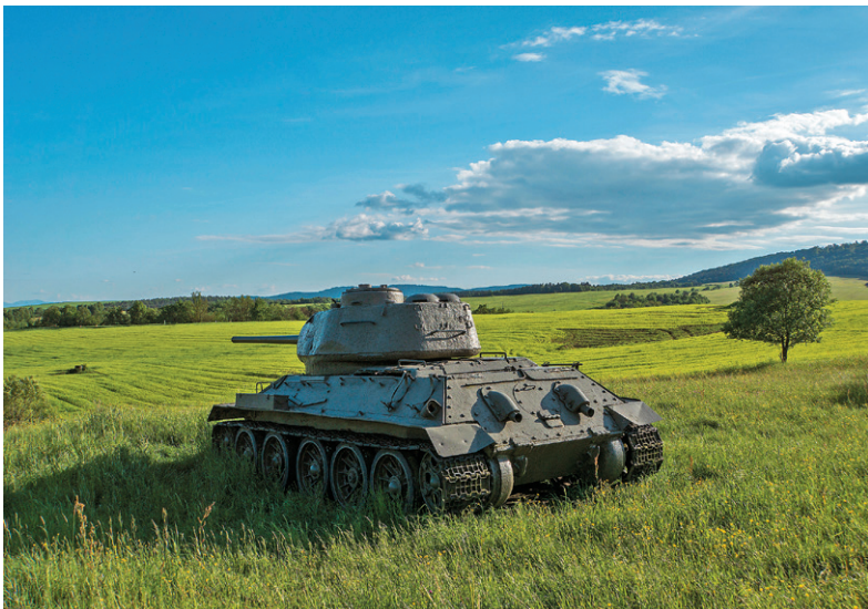
Údolie smrti pri Kružlovej Monastier v Krásnom Brode

Trasa A: Vyšný Komárnik – Beňadikovce – Veľkrop – Výrava – Stropkov – Bukovce – Krásny Brod – Medzilaborce – Kalinov – Habura – Osadné – Humenné – Jasenov – Ptičie – Kolonica – Runina – Topoľa – Nová Sedlica