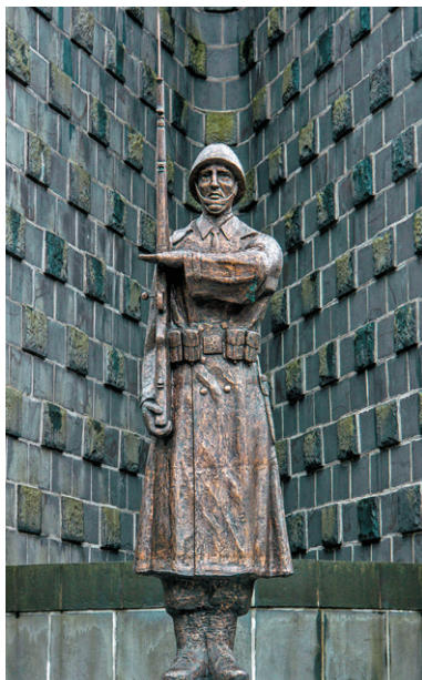
Československý vojak od J. Vítka

sovietskych vojakov padlých v tejto operácii sa nachádza vo Svidníku.