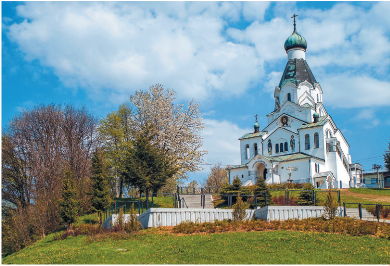
Chrám sv. Ducha v Medzilaborciach

Bohorodičky sa baziliánom úspešne podarilo ochrániť najprv pred vojskom a po druhej svetovej vojne pred komunistickými bezpečnostnými zložkami. Dnes je zázračná ikona v Kaplnke Pokrovu Presvätej Bohorodičky. Vedľa zrúcanín starého kláštora stojí od roku 2002 nový baziliánsky monastier, ku ktorému pribudol aj nový gréckokatolícky chrám.