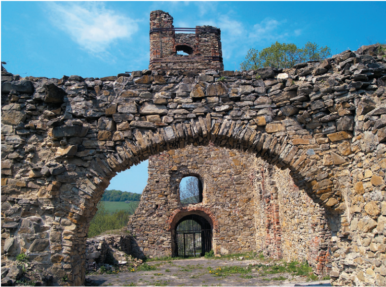
Zrúcaniny baziliánskeho kláštora v Krásnom Brode