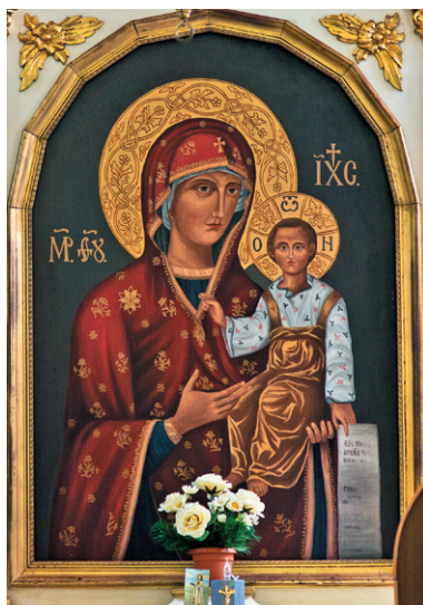
Zázračná ikona Bohorodičky

Druhé zničenie monastieru v Krásnom Brode nastalo začiatkom 18. storočia, počas povstania Františka II. Rákócziho. Kláštor s chrámom sa opäť obnovil, aj keď to trvalo príliš dlho. Výstavba chrámu bola ukončená v roku 1752. Za tretie zničenie baziliánskeho kláštora môže vojna. Najprv boli kláštorné zvony roztavené na delá, potom bol zničený celý kláštor zasiahnutý strelami rakúskych diel. Stal sa neobývatelným, a tak sa rehoľníci presťahovali do maďarského Máriapócsu. Ikonu