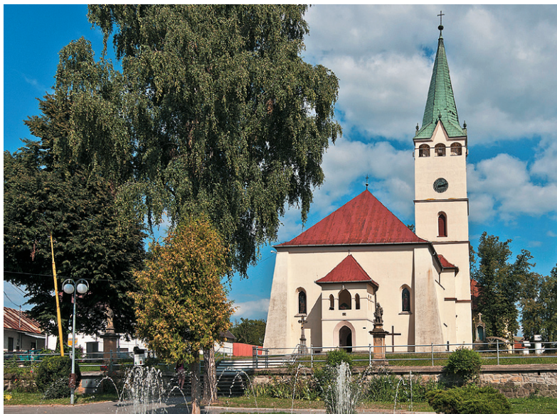
Kostol najsvätejšieho Kristovho tela a krvi v Stropkove