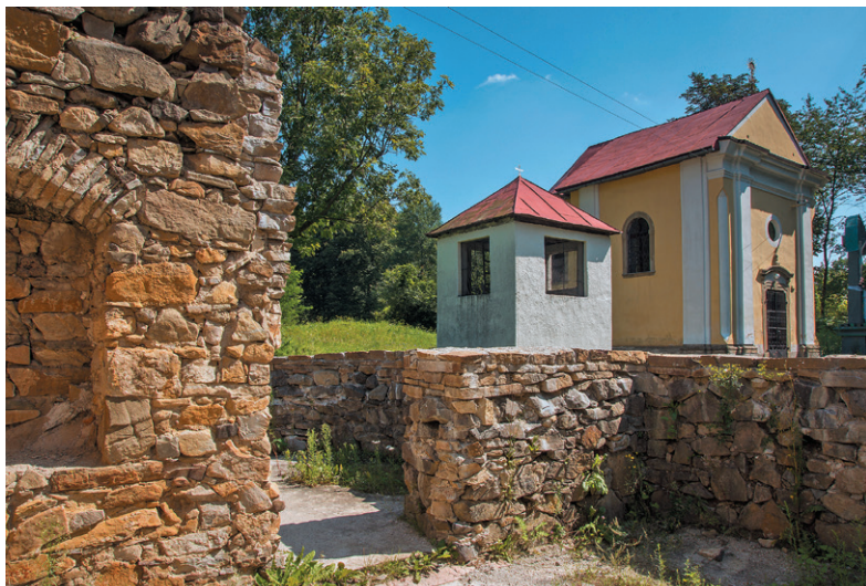
Kaplnka Pokrovu Presvätej Bohorodičky v Krásnom Brode

Záhľadným spôsobom bol ušetrený zázračný obraz Bohorodičky, ktorý našli pastieri neďaleko kláštora.