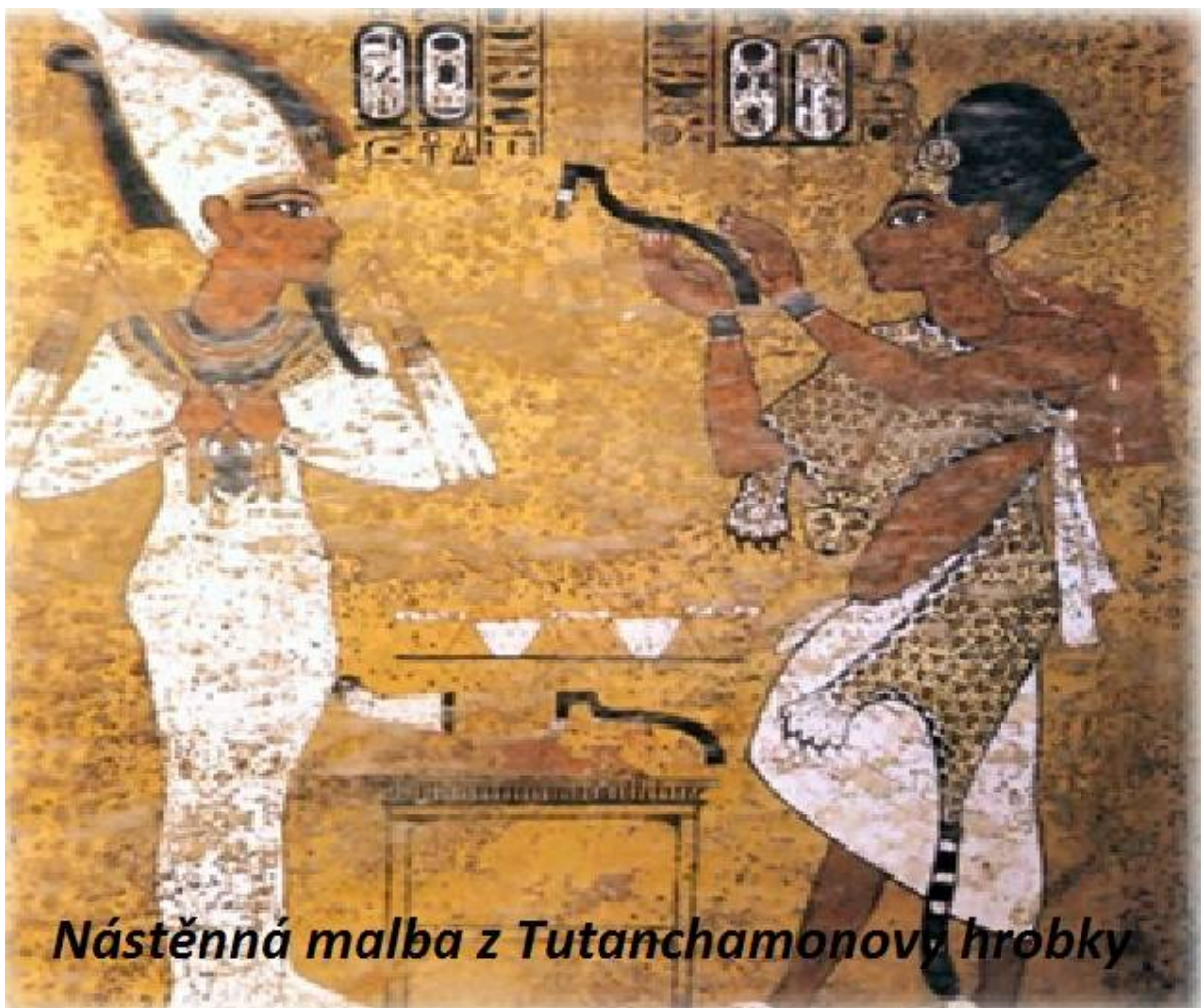
Nástěnná malba z Tutanchamonovy hrobky

4. listopadu 1922 archeolog Howard Carter a jeho tým objevili hrobku faraona téměř nedotčenou rabovači v egyptském údolí králů. Vzrušený Carter okamžitě telegraficky informoval o mimořádném objevu lorda Carnarvona, největšího sběratele egyptských starožitností a majitele koncese na práva na hloubení. Britského aristokrata, který snil o návštěvě nedotčené hrobky, nenapadlo ani ve snu, že se z objevu bude radovat velmi krátkou dobu.