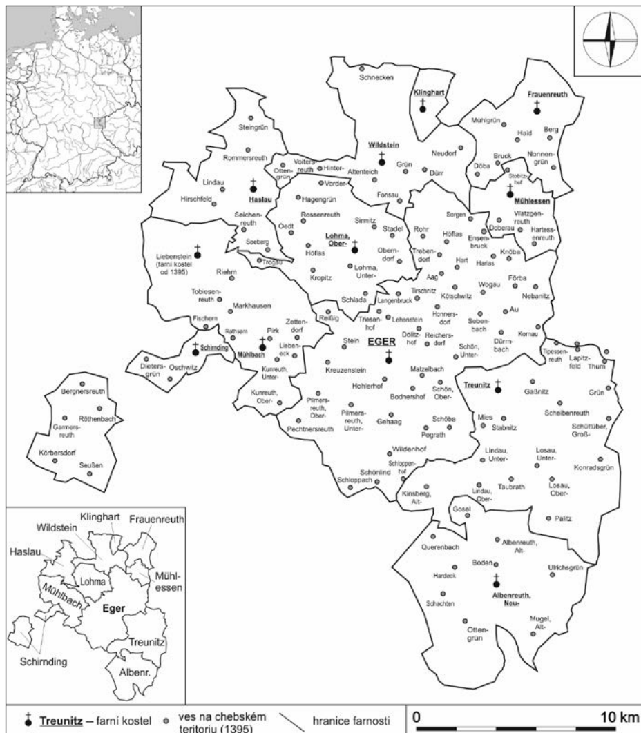
Obrázek 1. Administrativní členění Chebska podle farních obvodů roku 1395

Podle: Ar Cheb, kniha č. 974, Musterungsbuch der Bauernschaft .