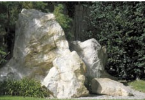
□ Soliterní kámen je typickým prvkem japonských zahrad

kteří rozmístěny přesně podle platných pravidel navozovaly dojem hor, ostrovů či mořského pobřeží.