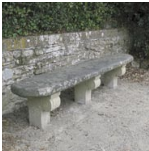
▣ Kamenná lavice v historické zahradě

V 18. století dochází k odklonu od pravidelné zahradní úpravy k zahradám a parkům krajinářským. Terén se rozsáhle upravuje do podoby ideální jednoduché krajinné kompozice. Největšího rozmachu dosahuje krajinářství v jižní Anglii, kde dochází k parkové úpravě rozsáhlých ploch. Postupně je do parkové podoby upravena velká část jižní Anglie. V krajinářském parku je kámen používán nejčastěji na stavbu mostků a ke zpevnění ploch. Postupně se objevuje vliv čínského zahradního umění. V zahradách a parcích se začínají stavět čínské pavilony a pagody. Některé stavby z tohoto období můžeme obdivovat dodnes, např. v Kew Garden poblíž Londýna. Na konci tohoto období vznikají rozměrné skleníky z litiny, které sloužily nejdříve jen k přezimování a později i k celoročnímu pěstování tropických exotických rostlin. I ve sklenících byl používán kámen jako stavební materiál pro zhotovení fontánek a opěrných zídek. Pěstují se také první kaktusy, které byly často aranžovány společně s vybranými kameny do aridních scenerií.