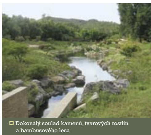
□ Dokonalý soulad kamenů, tvarových rostlin a bambusového lesa

Čína představovala unikátní prostředí pro vývoj zahradního umění a velmi silně ovlivnila tvorbu zahrad nejen v Japonsku, ale také v evropských zemích.