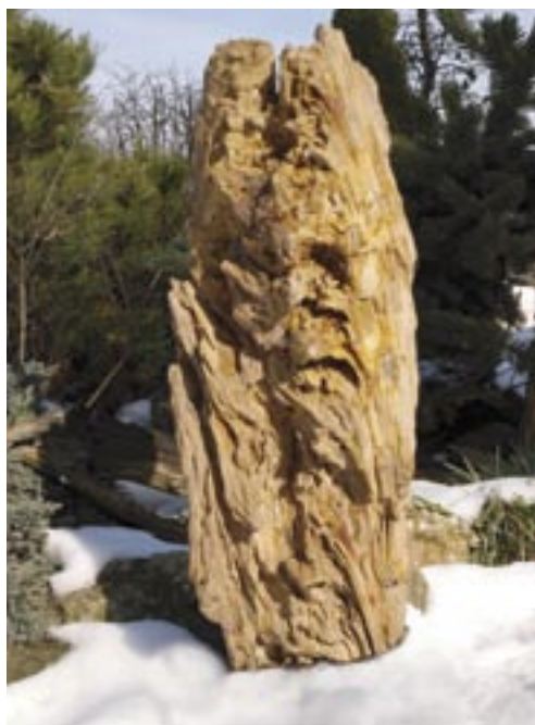
□ Soliterní kámen vynikne v zahradě i v zimě

V tomto období začínají do zahradních kompozic pronikat známé kamenné zahradní lampy. Kvalita jejich zpracování je ukázkou mistrovství japonských kameníků.