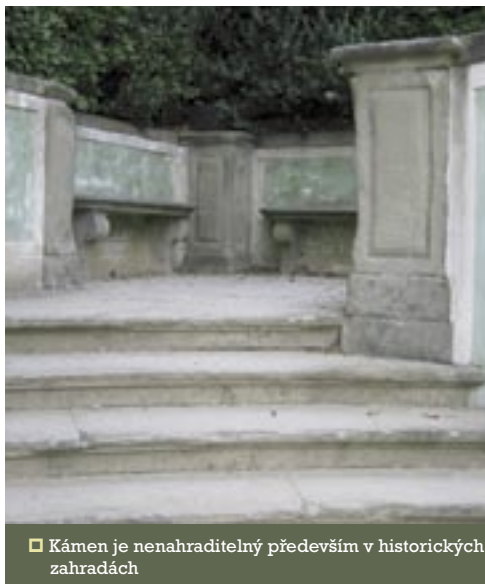
□ Kámen je nenahraditelný především v historických zahradách

bí se začínají stavět umělé jeskyně – grotty. Kámen byl dále používán ke stavbě nádrží, kašen a pro zhotovení váz a nádob. Typické pro toto období je použití důmyslných mechanismů pro vytvoření vodních efektů v zahradních kompozicích.