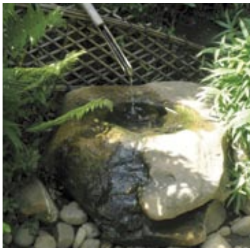
□ Vodní prvek v japonské zahradě – nádržka na vodu

V blízkosti čajového domku je vždy umístěn kámen vytvářející nádržku na vodu pro potřeby čajového obřadu. Do něj ústí bambusový přepad vody a na okraji je položena naběračka na vodu.