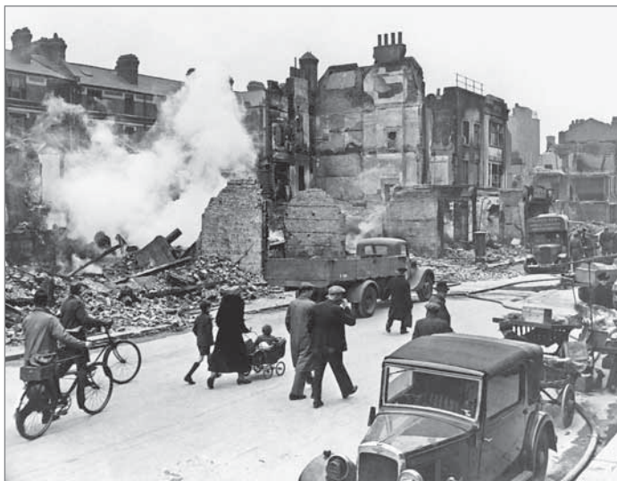
Londýn počas bombardovania