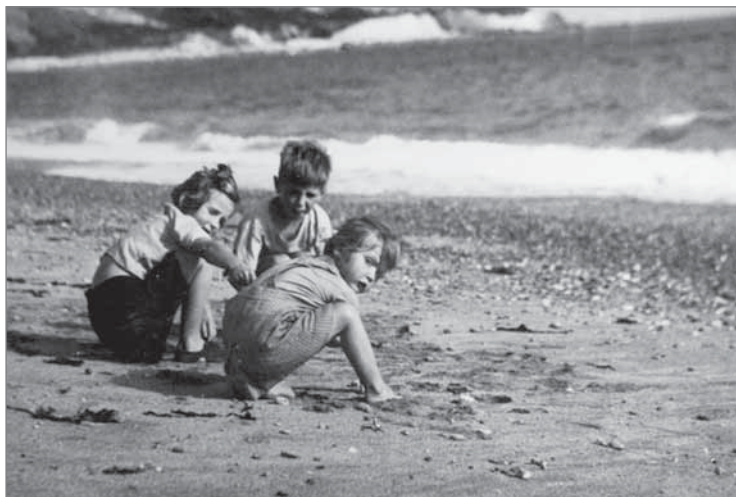
Moji súrodenci a ja na pláži

MOJA NAJRANEJŠIA spomienka je tá, ako stojím v materskej škôlke Byron House School v Highgate a revem ostošeť. Všetky deti okolo mňa sa hrali s úžasnými hračkami a ja som sa k nim chcel pridať. Mal som však iba dva a pol roka. Bolo to po prvý raz, čo som zostal opustený medzi ľuďmi, ktorých som vôbec nepoznal, a bál som sa. Myslím si, že táto reakcia mojich rodičov dosť zaskočila, pretože som bol ich prvé dieťa a riadili sa výchovnými príručkami, v ktorých sa písalo, že dieťa v dvoch rokoch by malo začať nadväzovať sociálne kontakty. Po tomto hroznom ráne ma však rodičia zobrali preč a späť do škôlky ma najbližšieho jeden a pol roka neposlali.