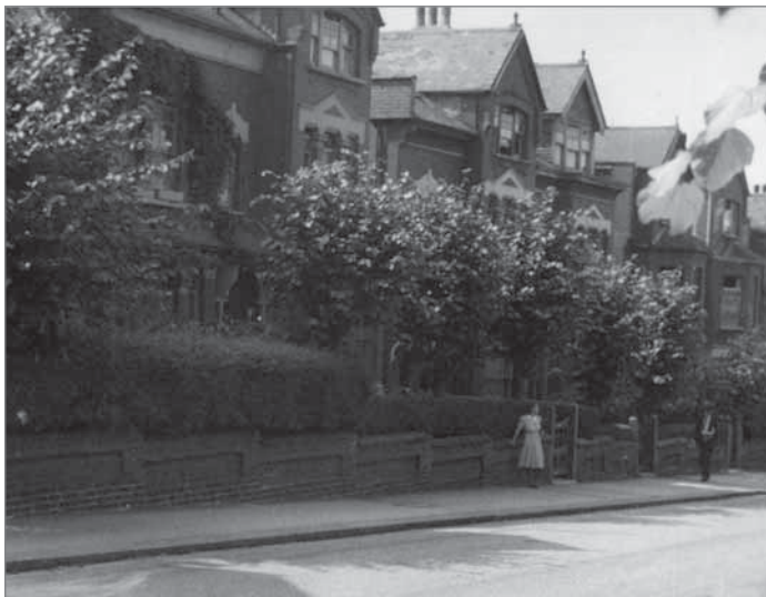
Naša ulica v Highgate v Londýne

dičia všetkých ostatných detí, ktoré som poznal. Chodil do obecnej školy, nie do Byron House School, a vedel všetličo o futbale a boxe, teda o športoch, ktoré by mojich rodičov nenapadlo sledovať ani vo sne.