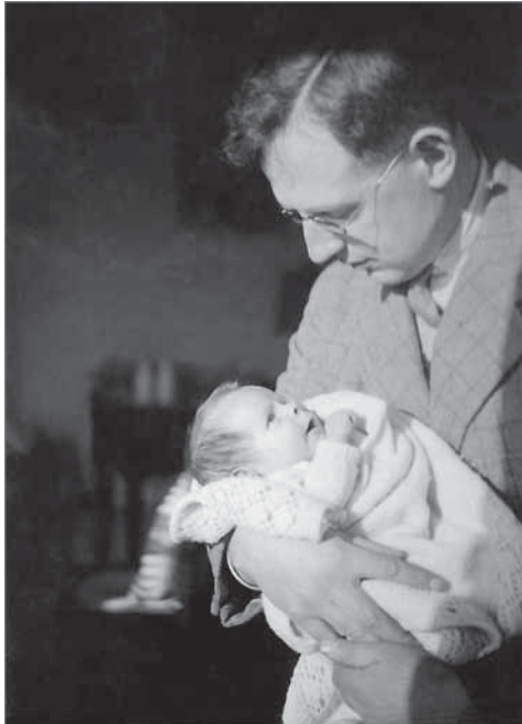
Môj otec a ja

Môj otec získal niekoľko štipendií a ocenení a mohol tak vrátiť rodičom peniaze, ktoré doňho investovali. Potom sa zapojil do výskumu v oblasti tropickej medicíny a v roku 1937 odcestoval do východnej Afriky. Keď vypukla vojna, precestoval takmer celý africký kontinent až do Konga, aby stihol loď, ktorá ho dopravila späť do Anglicka. Tam sa ako dobrovoľník prihlásil do vojenskej služby. Povedali mu však, že v lekárskom výskume je užitočnejší.