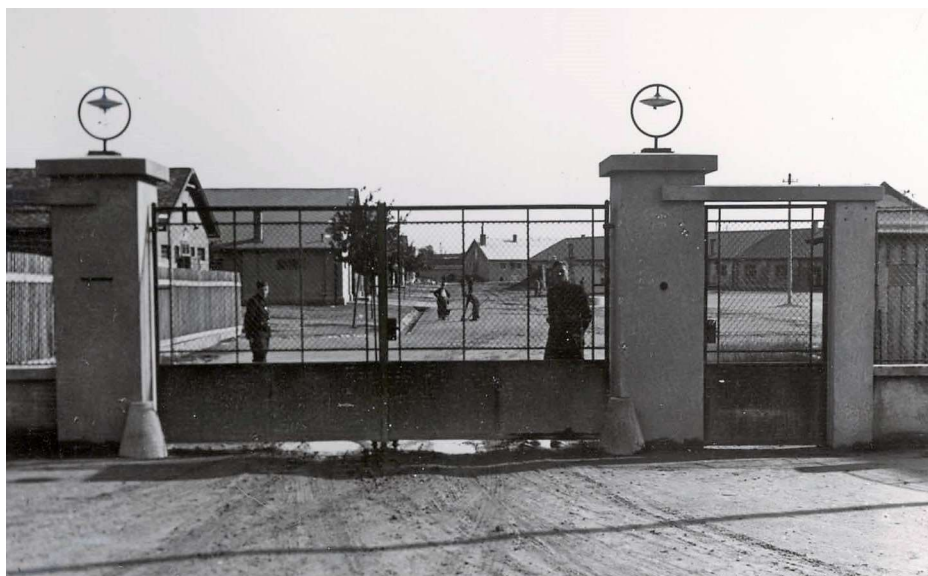
Vchod do seredského tábora.

Práca je rozčlenená do siedmich častí, a to úvod, päť kapitol a záver. Prvá kapitola je všeobecného charakteru a zaoberá sa vývojom židovských táborov na Slovensku, ich organizačnou a pracovnou štruktúrou a životom v týchto táboroch. Druhá kapitola sa venuje seredskému táboru, jeho výstavbe a vývoju od marca 1942 do augusta 1944. Tretia kapitola sa zaoberá hospodárskou stránkou tábora, hospodárskymi výsledkami, ktoré boli veľmi dôležité pre existenciu tábora. Štvrtá kapitola opisuje podmienky, v akých žili Židia v seredskom tábore. Posledná kapitola stručne opisuje obdobie, kedy tábor ovládali Nemci. V tomto období to už nebol výlučne židovský tábor, ale bez opisu dejín tohto obdobia by dejiny seredského tábora neboli kompletne.