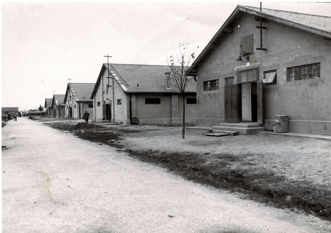
Baraky v seredskom tábore

centrálnu agendu viedlo Prezídium Ministerstva vnútra odd. 14 podľa predpisov a vyhlášok Najvyššieho úradu pre zásobovanie.