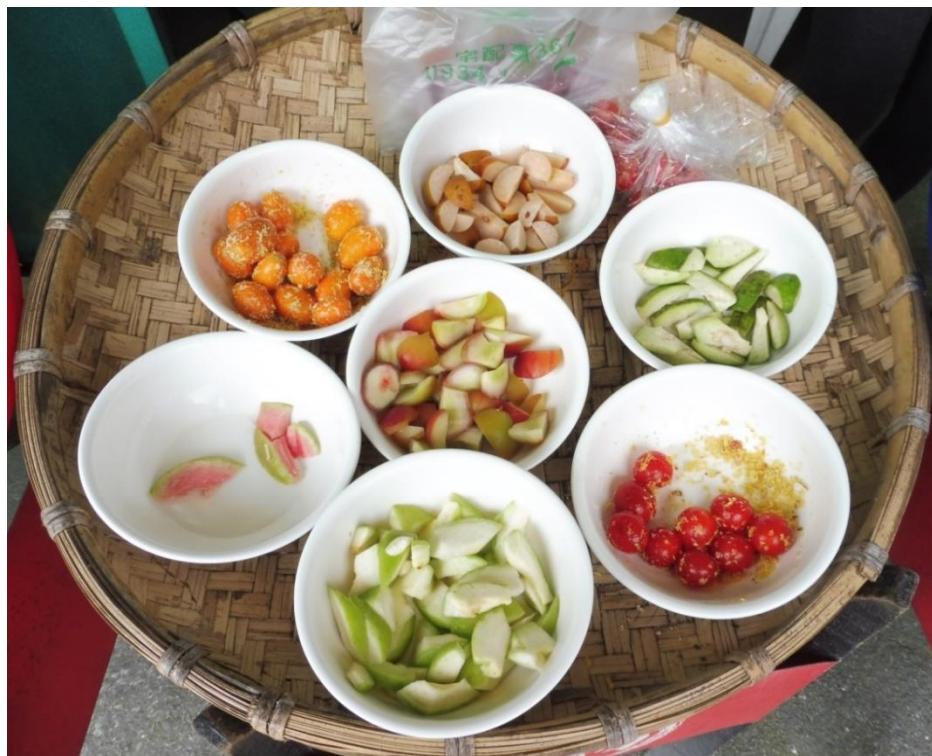
Chutné jídlo čhá na každém rohu

Žádný návštěvník by neměl vynechat zejména Národní park Taroko se spoustou stezek. Příroda kolem Taipei je také úchvatná, okamžitě mě zaujme její rozmanitost. Samozřejmě i samotné hlavní město stojí za průzkum, moderní mrakodrapy, nákupní centra, noční trhy a také nejrůznější chrámy či svatyně. Centrem náboženských památek je však Tainan na jihu země. Ten si rozhodně na svůj seznam také přidejte. Cestou se můžete zastavit v lesní rezervaci Alishan, vyhlášené svými východy slunce. Turisté také často míří k jezeru Sun Moon Lake. Zajímavým zpestřením může být návštěva palírny