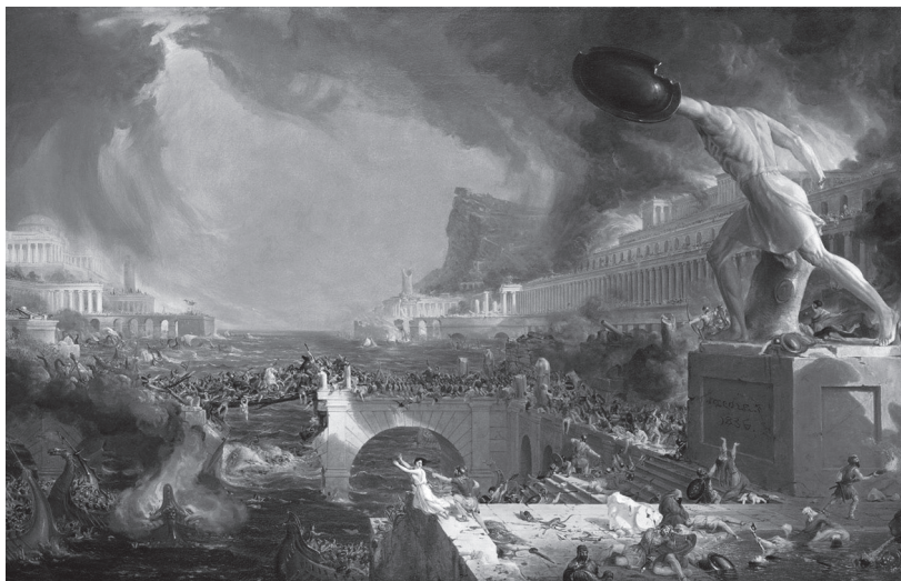
Nastane kolaps každej civilizácie? (Mal'ba: Thomas Cole.)

termínmi decline či decay (v slovenčine ide v podstate o synonymá slova úpadok), ktoré nevedú nevyhnutne ku koncu civilizácie, a ďalšími, ako sú fall , collapse a death (pád, kolaps, smrť). Tie posledné by už mali znamenať skutočný kolaps, teda zánik.* 8