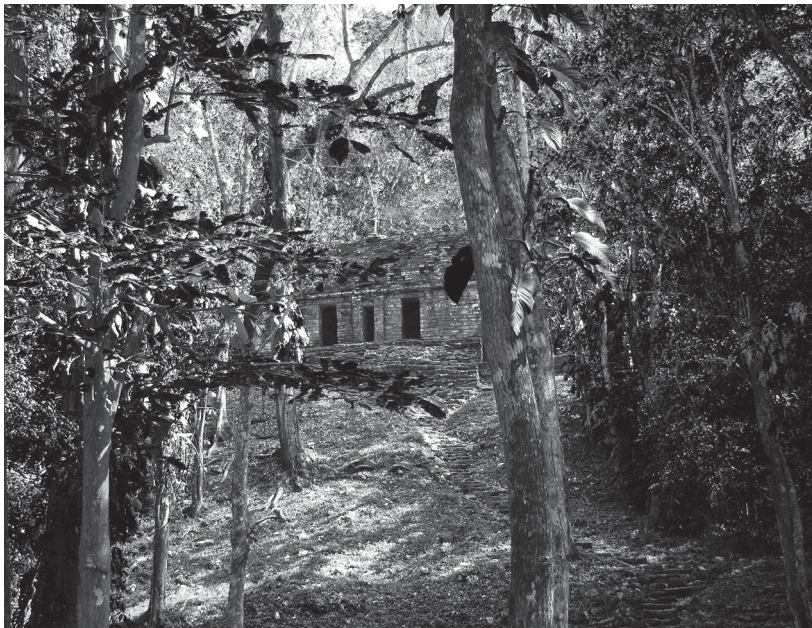
Opustené mayské mesto Yaxchilan.

burzy na Wall Street alebo revolúcie od Maroka až po Perzský záliv? Objavili sa síce experti, ktorí predpokladali finančnú krízu alebo pád autoritatívnych režimov v moslimských krajinách – ale dostali sa do hlavného mediálneho prúdu? Ak aj niekto predpovedal finančnú krízu alebo arabské revolúcie, určite nedostal miesto v mienkotvorných médiách. Rovnako len málo ľudí bralo na zreteľ varovania niekoľkých vedcov pred možnou globálnou vírusovou pandémiou.