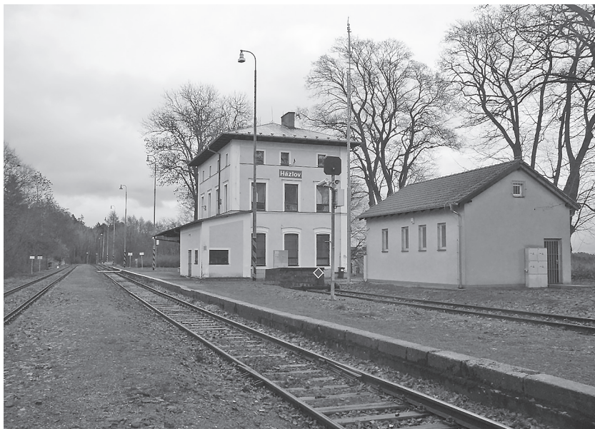
Nádraží v Hazlově: Tady pachatelé vlezli do brzdařské budky

seskočit, počká, až vlak zpomalí ve Františkových Lázních. Zatímco Waldheim se notně potluče, Bergmannovi se podaří nepozorovaně se vrátit do Aše, v bytě své družky se převléknout a přes „zelenou hranici“ uprchnout do Bavorska.