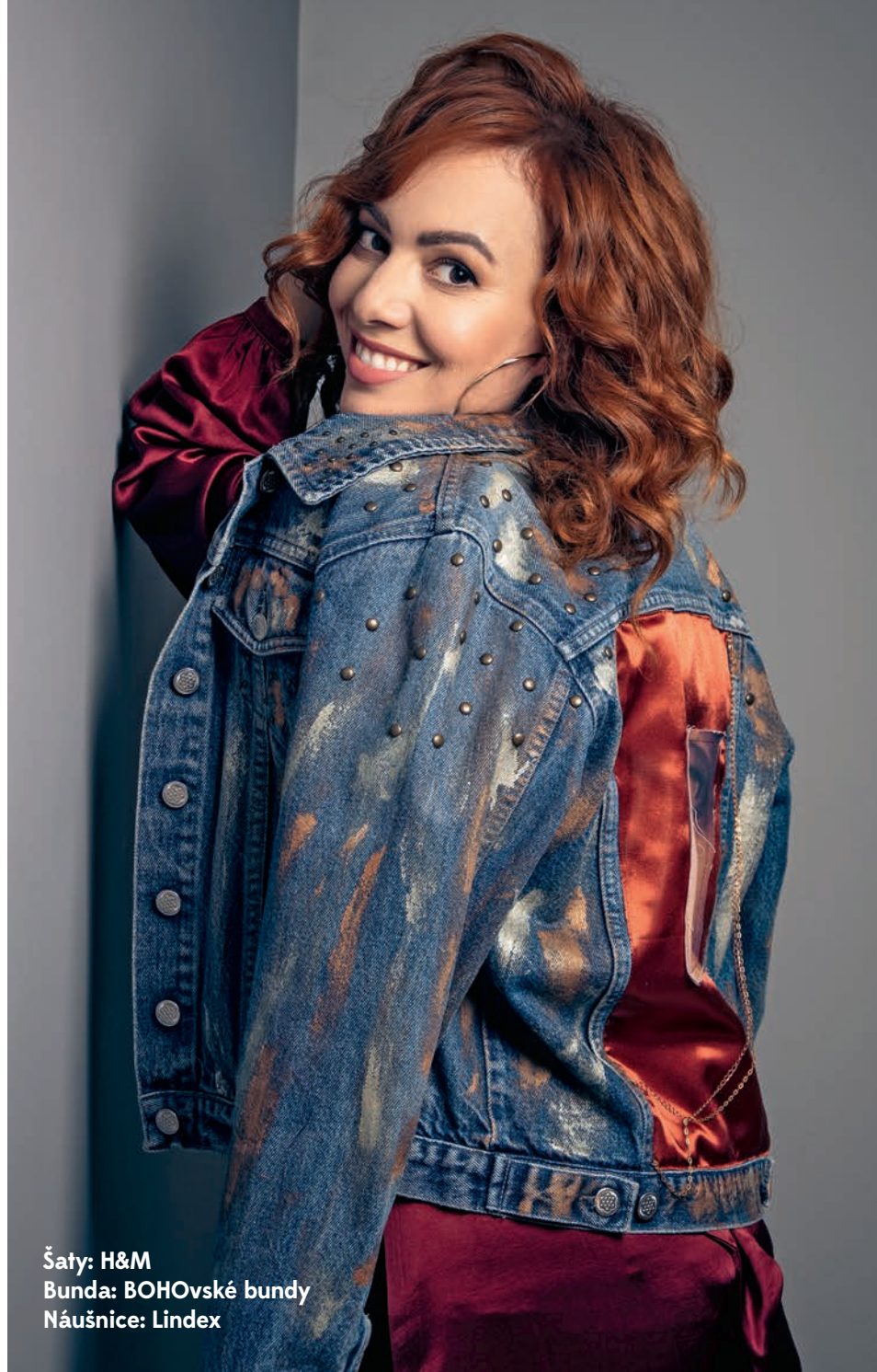
Šaty: H&M Bunda: BOHOVSKÉ BUNDY Náušnice: LINDEX

Napríklad, aj keď som v marci mohla za nimi konečne priletieť a oni si kreslili, koľkokrát sa ešte vyspia, prišla korona. Zrušené lety, nedalo sa vycestovať, nemohla som prísť. To som videla, že im sa rozpadol svet. Mali napísané, čo im mám doniesť z izbičky, ktoré hračky, ktorých plyšákov, a zrazu sa nedalo.