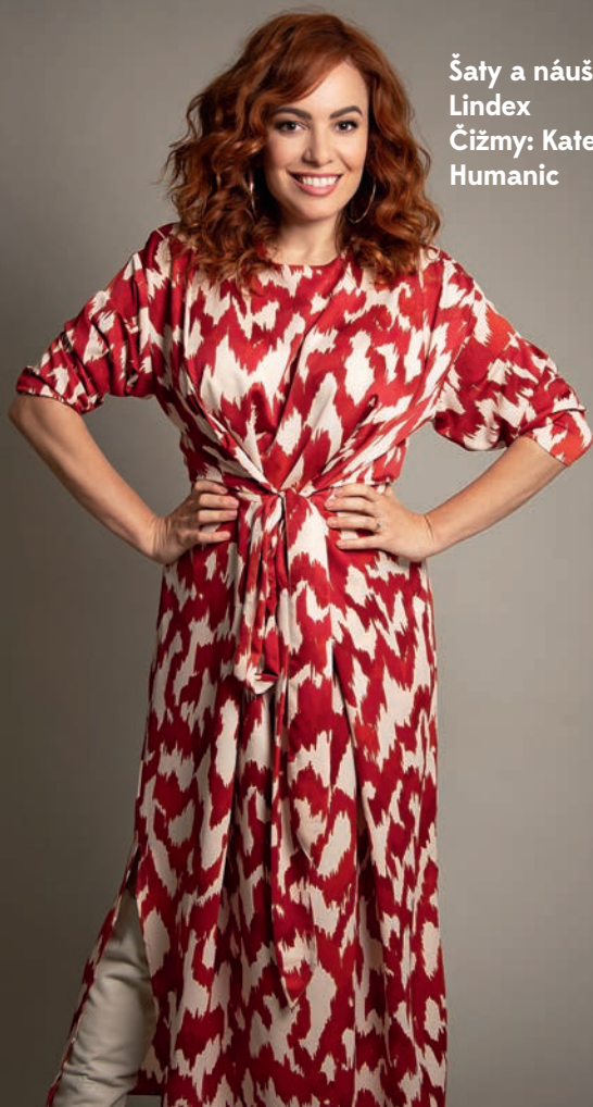
Šaty a náušnice: Lindex Čižmy: Kate Gray, Humanic