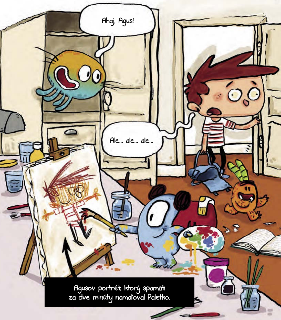
Agusov portrét, ktorý spamäti za dve minúty namaloval Paletko.

Keď som konečne prišiel domov, iba som pozdravil rodičov a šiel rovno do svojej izby. Moji kamaráti ma už očakávali. Sú trochu zvláštni, to áno, ale kde inde by som našiel takých priateľov, ako sú oni? Pravda, niekedy to trochu preháňajú... nuž ale tomu sa jednoducho nedá vyhnúť.