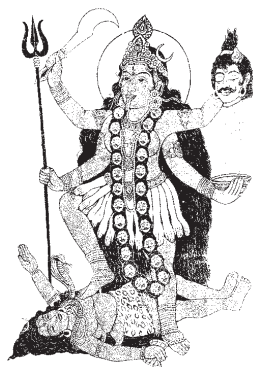
Káli. Meč (moudrost) utíná hlavi (ego).