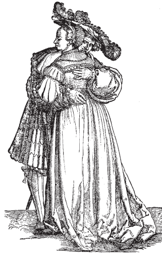
Nahoře: Objímáním se uvolňuje vazopresin a oxytocin; učíme se mu velmi záhy.