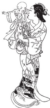
Matka a dítě. Japonsko 1739.