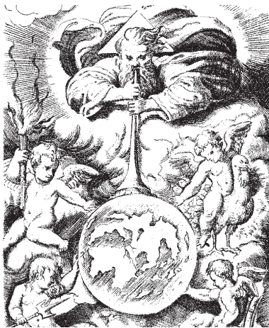
Bílý otec a stvořitel, Giulio Bonasone, Bologna, 1574.