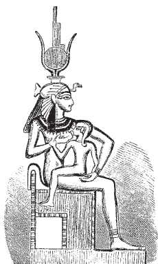
Isis se svým synem Horem. Srovnajme s obrázkem dole.