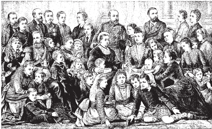
Nahoře: Britská královská rodina, 1877. Rodové příbuzenství posiluje pocit souvazežitosti a mezigenerační kontakty obohacují všechny generace.