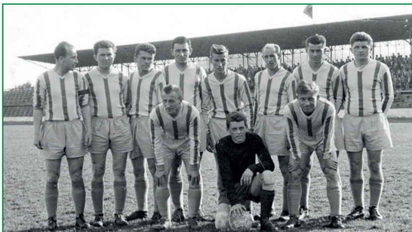
Rovněž táta byl oporou týmu, i když gólům jako brankář především zabraňoval

I když v té době toužil hrát závodně snad každý kluk, neboť nebylo moc jiných lákadel, litvínovský oddíl – jak se tehdy fotbalová se-