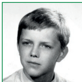
Členský průkaz ČSTV žáčka litvínovského klubu

Tréningy v oddíle mu nestačily, na jeho střeleckém růstu měl nadále velký podíl otec. Ve volných chvílích chodili na hřiště, kopali si, přihrávali, zpracovávali míč. A především stříleli. Patou, špičkou, celou botou. „Placírka, nárt, šajtle, musel jsem zvládnout všechno. Došlo i na vysmívané bodlo,“ popisuje procvičovanou techniku kopu, která se dnes už moc nenosí.