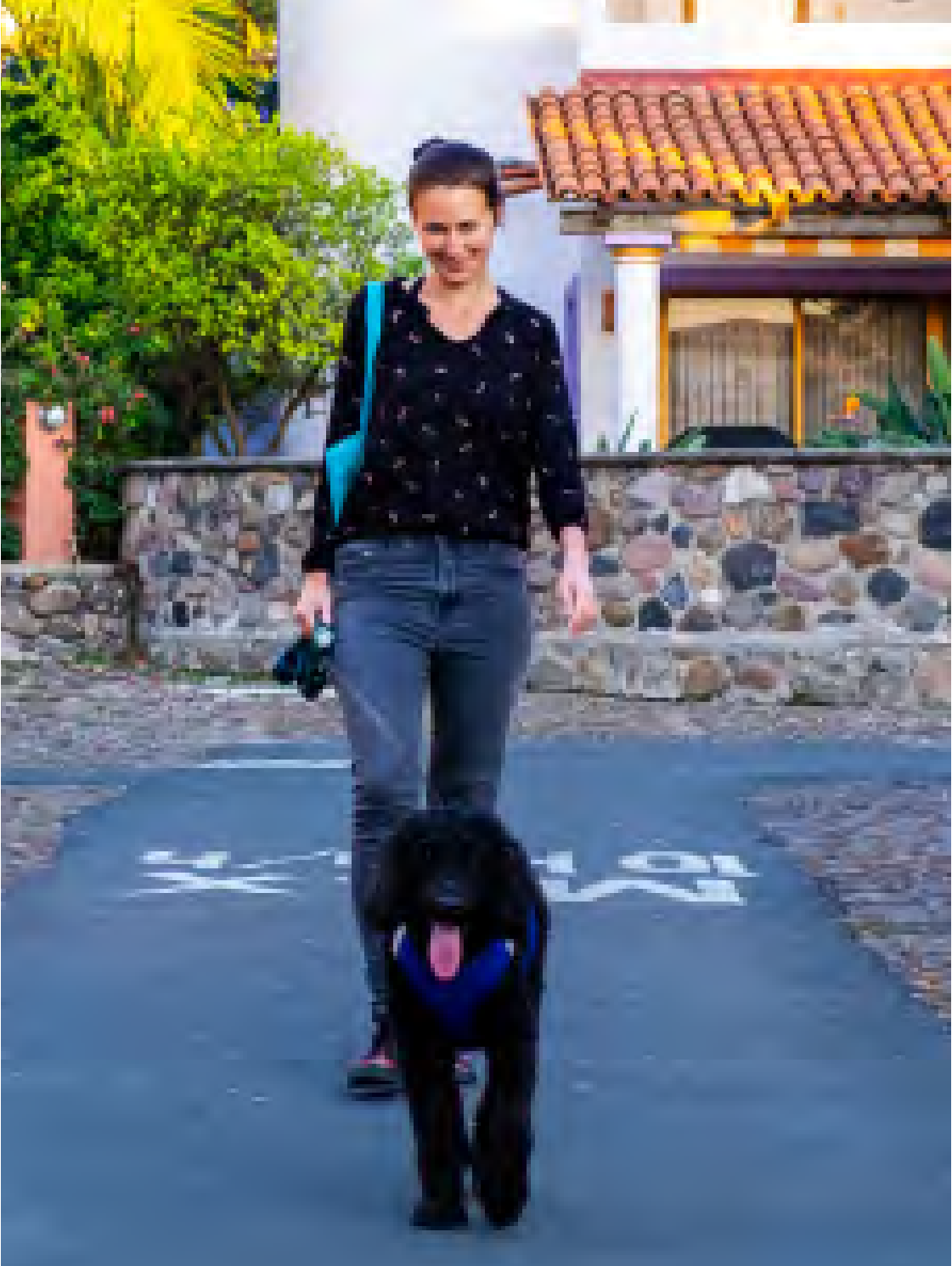
Venčenie Teddyho v Mexiku