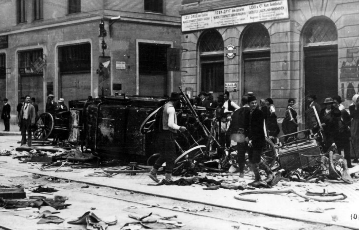
Bezprostředně po atentátu na Františka Ferdinanda d'Este vypukly v Sarajevu protisrbsky zaměřené pouliční nepokoje včetně ničení a vypalování srbských obchodů a bytů.