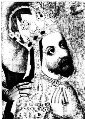
Karel IV. na votivním obrazu Jana Očka z Vlašimi

Málokde na člověka tak dolehne povznášející (a současně trochu mrazivý) pocit moci a síly, jako když poprvé spatří z mostu přes Ohři hrad Loket, to drsné nakupení strohých kamenných zdí a věží, do jejichž stěn jako by prorůstaly hroty žulových skal. Tohle mimořádné sídlo si troufám srovnávat s proslulou Mont-Saint-Michel na normanském pobřeží. Naši horu s hradem a opevněným městem však neobklopuje mořský záliv, ale něco neméně pozoruhodného: unikátní meandr řeky Ohře. Stojím na úzké, jen několik metrů široké šíji, oddělující dvě údolí téže řeky. Nemohu odtrhnout pohled od místa, kde Ohře náhle odbočí v nečekaně ostrém úhlu, skuteč-