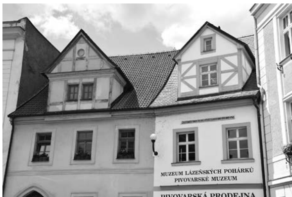
Pohlední sousedé: T. G. Masaryka 4/75 a Sobotova 10/2

Kostelní 81/25. Zato budova Základní školy Loket na opačné straně příliš půvabu nepobrala a její kostka městský oblouk spíše kazí.