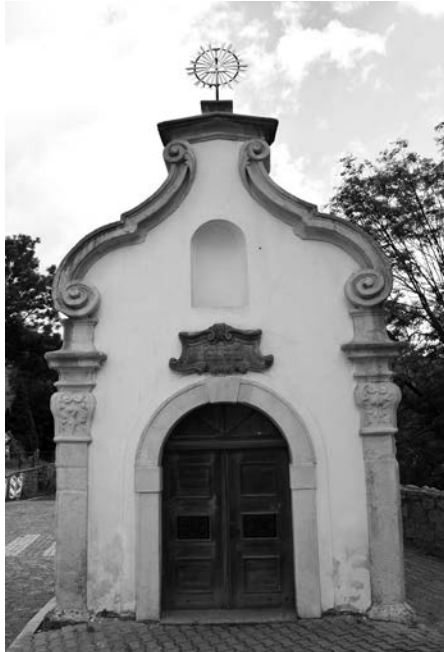
Kaple sv. Anny na terase nad Zahradní ulicí

pitulaci a vydání hradu. Došlo k dosud neslýchanému boji mezi manželi. Bitka se protáhla dlouho do noci, aniž se obléhatelům podařilo dosáhnout úspěchu. Na obou stranách už bylo několik raněných i padlých.