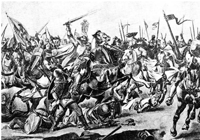
Smrt Jana Lucemburského v bitvě u Kresčaku

o svobodném odchodu ze země. Jan Lucemburský se tak díky své manželce Elišce téměř nenásilně a bez krveprolití zmocnil Prahy. A ubytoval se v jejím paláci U Kamenného zvonu.