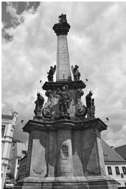
Sloup Nejsvětější Trojice v ulici T. G. Masaryka

byli brzy královským vojskem přemoženi – a trestu neušli. Vilém Zajíc z Valdeka byl zbaven úřadu nejvyššího maršálka a uchýlil se na své podbrdské panství; jeho místo zaujal jeho sok Jindřich z Lipé. Také bývalý opat zbraslavského kláštera Konrád, který se kdysi nejvíc zasloužil o příchod Jana Lucemburského na český královský trůn, se uchýlil do ústraní svého kláštera a vzdal se jakékoliv další politické a veřejné činnosti. Jen tím unikl pomstě zuřícího panovníka.