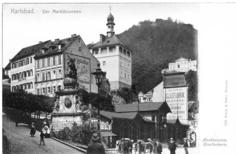
Morový sloup, Tržní kolonáda a Zámecká věž v roce 1898

historie zdejších lázní velmi hluboko do minulosti. V dobách, kdy v Loketské oboře lovil císař Karel, byly Vary už známým a proslulým místem. Císař zřejmě hledal úlevu v blahodárné minerální vodě, horké koupele zmírňovaly úporné bolesti jeho páteře, jimiž trpěl po záhadném úrazu; údajně se inkognito zúčastnil rytířského turnaje a úder dřevcem do brady mu zlomil čelist a poškodil krční páteř. Je skoro zázrak, že toto zranění přežil! Proto panovník během pobytu na Lokti pravidelně zajížděl do Varů.