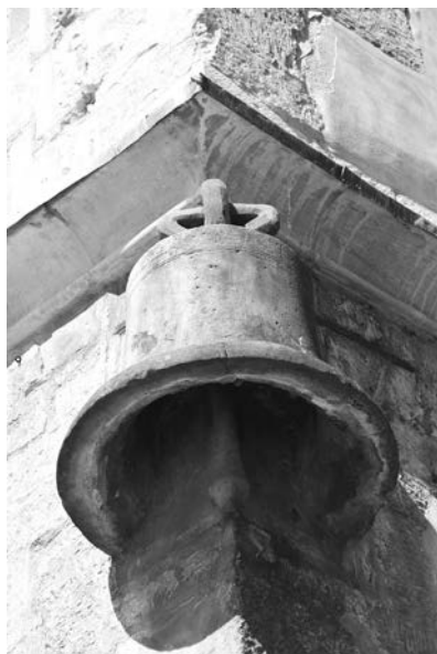
Kamenný zvon dal jméno výjimečnému domu

Důkladná regotizace vrátila domu téměř původní podobu, včetně tvaru střechy a oken, jejichž kružby se podařilo sestavit z kousíčků nalezených ve výplních zazděných oken a výklenků. Ve vnitřních prostorách byly odkryty dřevěné stropy a zpod omítek se vyloupily středověké nástěnné malby obou kaplí a audienční síně. V úplnosti byla odkryta také zdobná gotická fasáda. Ukázalo se, že výklenky mezi okny původně vyplňovaly kamenné sochy, posazené na konzolách a shora chráněné kamennými baldachýny. V nikách mezi okny prvního patra bychom kdysi viděli sochy krále a královny (Jana Lucemburského a Elišky Přemyslovny), sedící na trůně a po stranách doprovázené pěšími rytíři v plné zbroji. Snad to byli takzvaní štítonoši, ale také se usuzuje, že mohlo jít o podobizny jejich synů, princů Václava (Karla) a Jana Jindřicha. Torza těchto soch při rekonstrukci sestavil z úlomků restaurátor Jiří Blažej a dnes je můžeme vidět v kapli v přízemí. Sochy z výklenků dru-