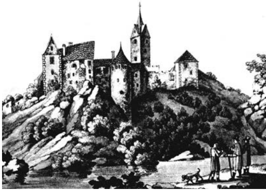
Loket na počátku 19. století

Půvabnou, byť trochu omšelou – a nespojitou – Zámeckou ulicí sejdem na hlavní náměstí T. G. Masaryka (za náměstí je považuji já, oficiálně jde překvapivě o ulici). Má zajímavý zakulacený tvar, volně kopírující jižní oblouk hradu, a opět jako by tonulo v jeho stínu. Přitom jsou tu zajímavé památky: pěkný trojiční sloup, dvě kašny a barokní radnice (v jejím areálu najdeme i městskou knihovnu a Muzeum knižní vazby); a celá řada hodnotných domů, původně gotických či barokních. Většinou prošly pozdějšími úpravami a dnes nastavují náměstí svá klasicistní, empírová či novorenesanční průčelí, takže si každý přijde na své. V mých očích jsou nejkrásnější sousední domy T. G. Masaryka 4/75 a Sobotova 10/2 (druhý jmenovaný skrývá Muzeum lázeňských pohárků).