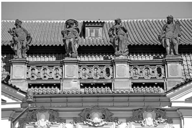
Sochy Ignáce Františka Platzera na atice paláce Golz-Kinských

zvonu. Toto rokokové sídlo bylo pro hraběte Jana Arnošta Golze postaveno podle plánů Kiliána Ignáce Dientzenhofera. Stavbu jako takovou v letech 1755-1765 řídil Anselmo Lurago, jeho následovník (ale nikoli zeť, jak bývá mylně uváděno), protože Dientzenhofer byl tou dobou už po smrti. V kontextu této kapitoly je pěknou shodou okolností, že Lurago zemřel roku 1765 ve svém domě U Černého slona – v onom malostranském. Fasádu vyzdobil štukatér Bossi, za sochařskou výzdobu vděčíme Ignáci Františku Platzerovi.