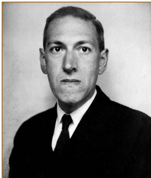
HOWARD PHILLIPS LOVECRAFT (20. srpna 1890 – 15. března 1937)