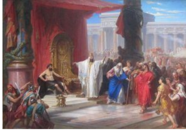
King Solomon and the Iron Worker, oil on canvas painting by Christian Schussele, 1863, Pennsylvania Academy of Fine Arts