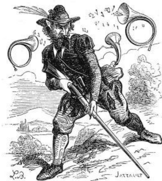
Français Barbatos. Ilustrace pekelného slovníku Jacquese Auguste Simona Collina de Plancy par Louis Le Breton, 6. vydání, 1863

Současně musíte pochopit, že nejde o jedno pojednání, ale o řadu různých grimoárů, spojených společným tématem a připisovaných králi Šalomounovi. Mezi nimi jsou také související díla jako „Klíč Šalamounova poznání“ a „Dílo Šalamouna“ objevené Ptolemaiosesem a texty, které se od ostatních liší obsahem i kapitolami. Na rozdíl od tradice založené díky knize MacGregora Mathersa (Clavicula Salomonis), která se skládá ze sestavených kapitol, které však neobsahovaly kapitoly mnoha klíčů, například Klíč poznání, není považován za jediný text, ale za odlišný a často nezávislý a představující různé magické systémy knihy.