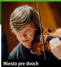
Miesto pre dvoch