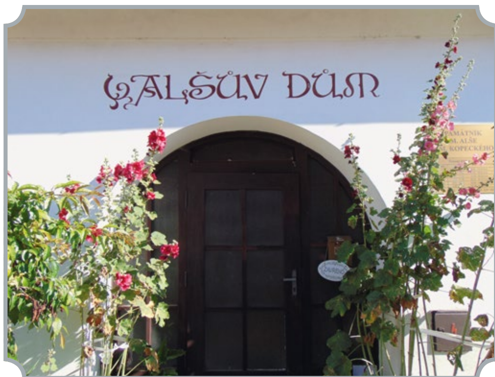
Vstup do Alšova domu zdobí květiny.

a tak se musely obě instalace umístit do Alšova domu. Otevřeno bývá od dubna do října celý týden kromě pondělí. Dospělí platí třicet korun, děti polovic.