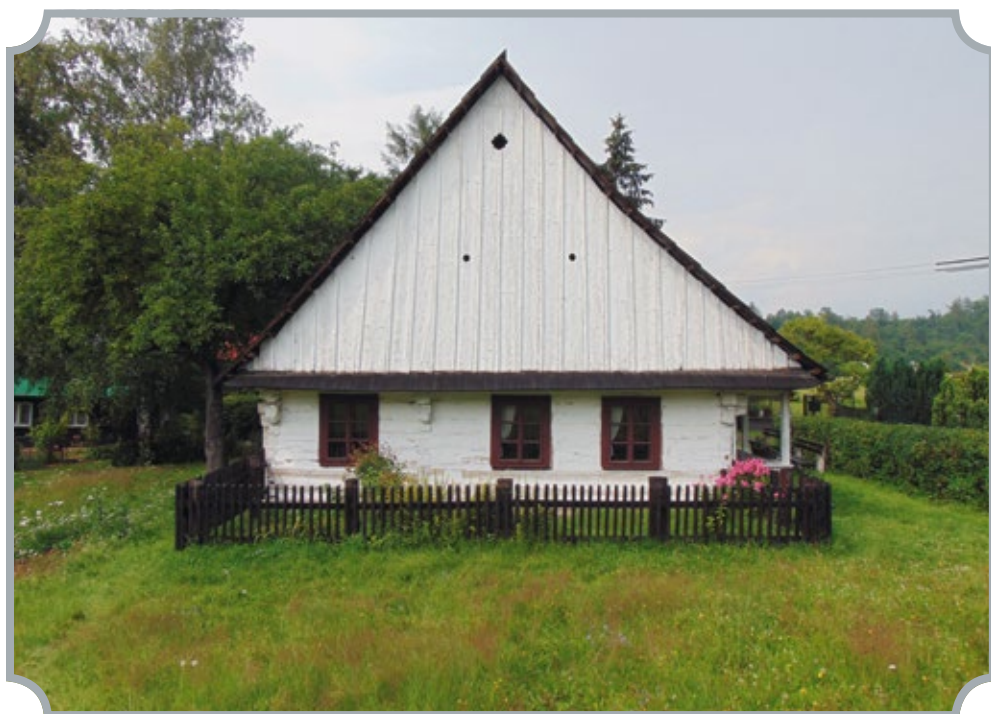
Divišova rodná chalupa stojí u rušné silnice.

Atmosféru starých časů přináší návštěva rodné chalupy Prokopa Diviše v Helvíkovicích. Stojí u rušné silnice mezi Vamberkem a Žamberkem. Tento lidový roubený domek má otevřeno od května do září celý týden