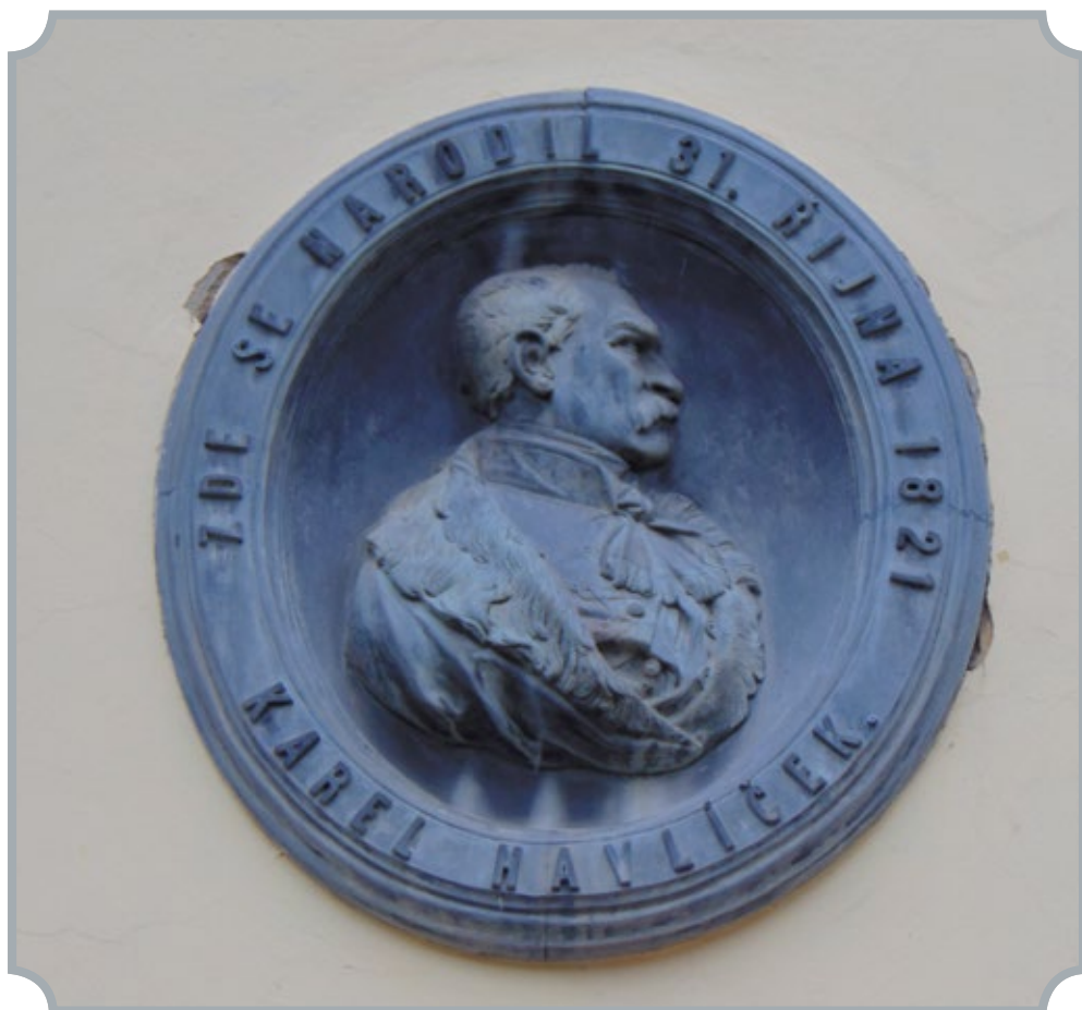
Reliéf ve štítu domu byl odhalen v roce 1862.

manželčin hrob a také svoji dceru. Do Prahy odjel znovu na jaře 1856, aby se podrobil lékařské prohlídce. Na doporučení lékařů se poté léčil v lázních Chuchle a Šternberk, odkud byl v červenci převezen do Prahy a tam 29. července 1856 zemřel na tuberkulózu. Pohřeb se konal 1. srpna 1856. Karel Havlíček Borovský je pochován na Olšanských hřbitovech.