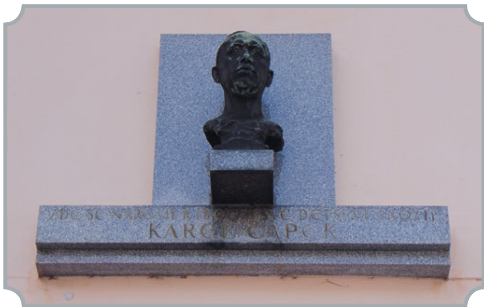
Busta Karla Čapka na rodném domě v Malých Svatoňovicích.

Na Strži napsal některá svoje zásadní díla. Mimo jiné Válku s mloky, Bílou nemoc nebo Matku. Čapkův památník byl zpřístupněn veřejnosti v roce 1963. Po velké rekonstrukci byl opět otevřen v roce 1997. Je věnován i Olze Scheinpflugové. V podkroví je samostatné expozice novináře Ferdinanda Peroutky, který byl u Čapků nejčastějším hostem. Několik let už funguje ve Staré Huti i naučná stezka Karla Čapka. Na Strži v autentickém prostředí se natáčel i film Člověk proti zkáze režiséra Štěpána Skalského. Karla Čapka si zahrál Josef Abrhám a Olgu Scheinpflugovou Hana Maciuchová.