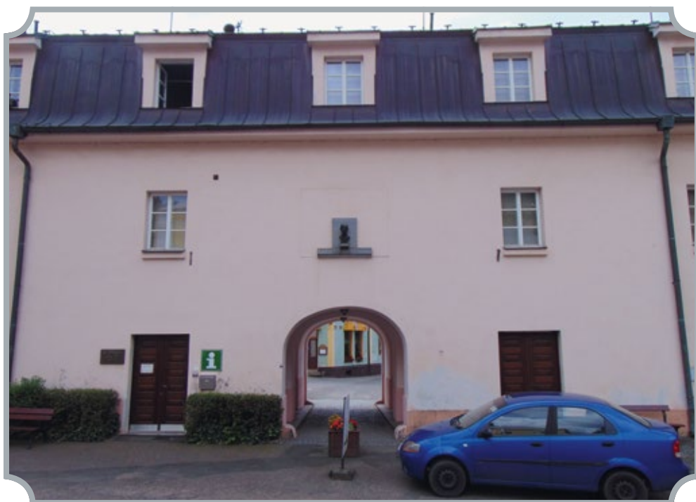
Rodný dům Karla Čapka na náměstí je dnes muzeem obou bratří.

„Člověk musí jet daleko, hrozně daleko, aby se dostal co nejbliž k domovu.“ Tento citát Karla Čapka dodnes zdůrazňují v Malých Svatoňovicích, kde se tento mezinárodně uznávaný autor narodil.