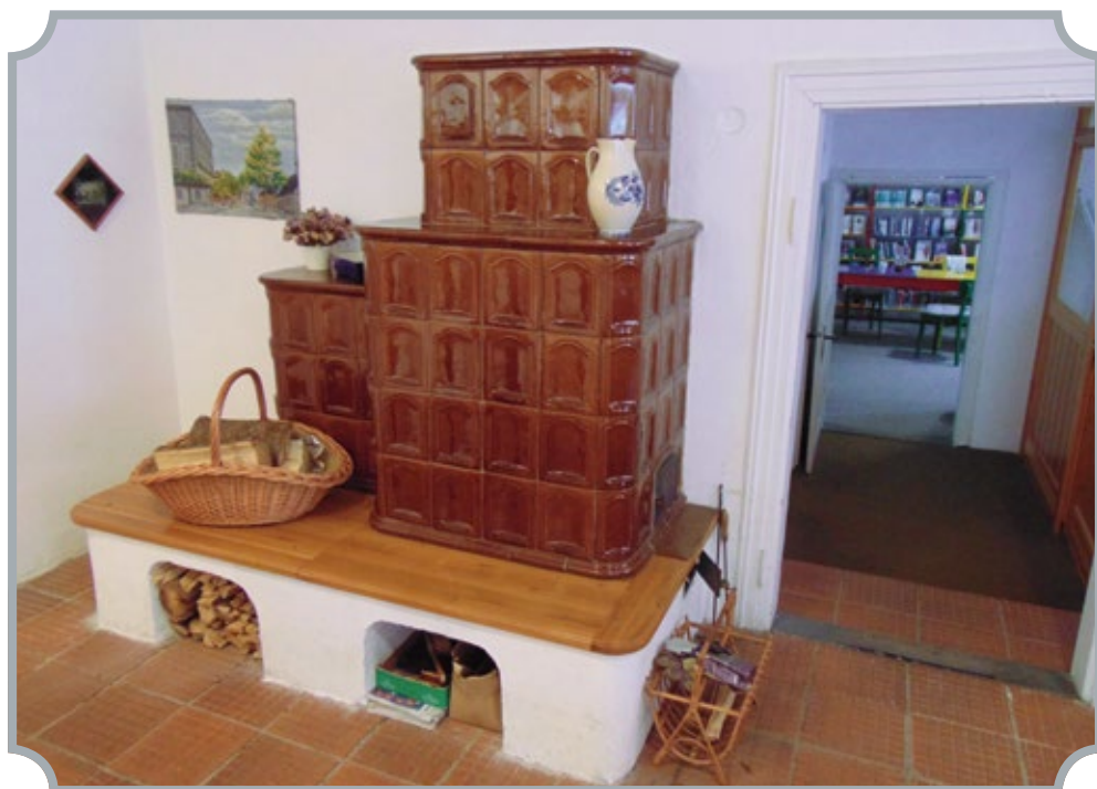
Uvnitř je útulno i v chladných dnech.

Havlíčkův rodný dům je od počátku sedmdesátých let minulého století národní kulturní památkou. V roce 1998 jej převzala od státu obec. Odvrátila tak hrozbu, že expozice bude uzavřena z důvodů úspor na státní úrovni. A také kvůli tehdejší podobnosti zaměření s výstavou v nedalekém Havlíčkově Brodě. Nyní už je náplň obou muzeí odlišná. V Borové