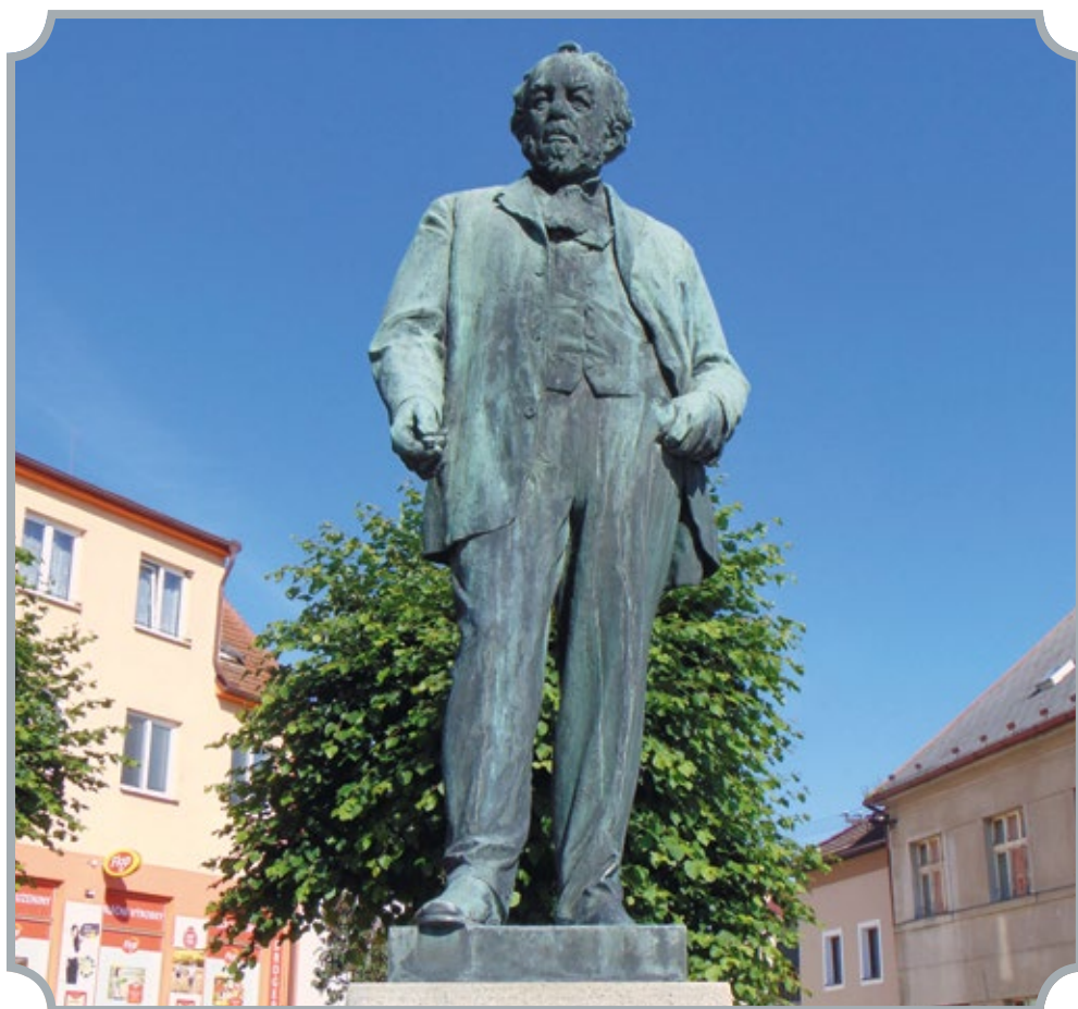
Na mirotickém náměstí stojí malířova socha.