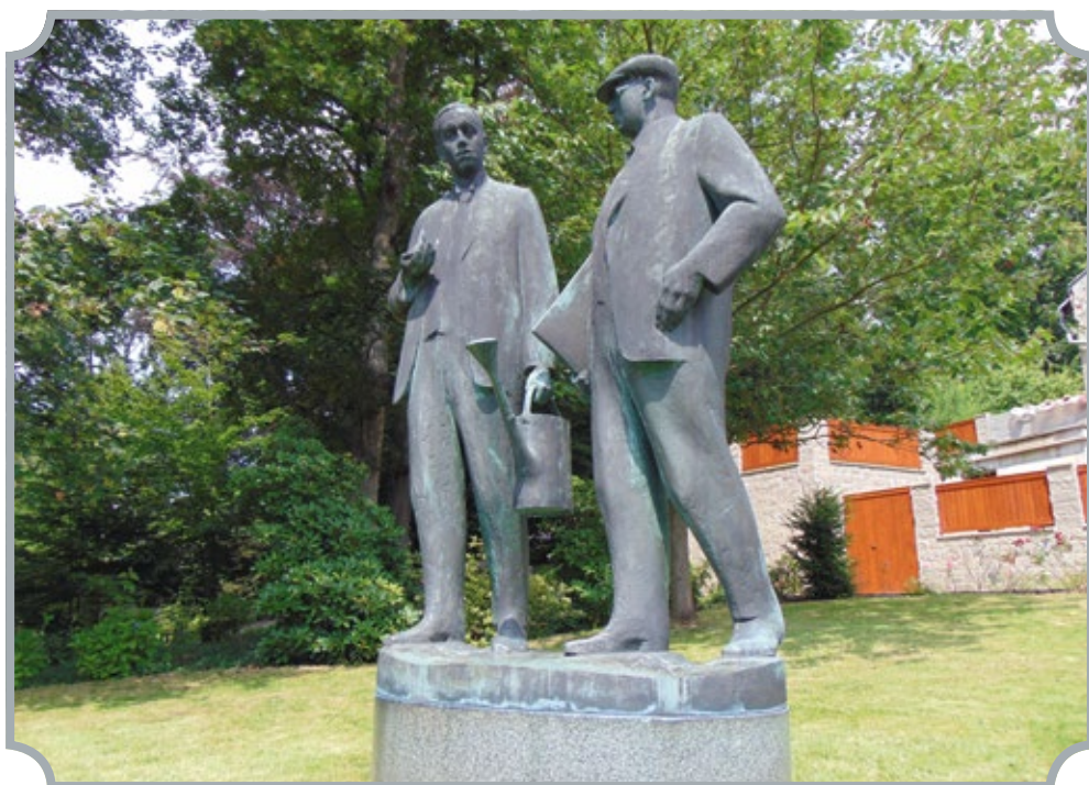
Bronzové sochy v životní velikosti bratří Čapků v Malých Svatoňovicích.

Druhé patro muzea je věnováno Josefu Čapkovi. Jsou v něm vystaveny olejomalby mapující postupně všechny fáze jeho tvorby. Nescházejí ani kresby a připomenutí jeho literární práce. Olejomalby obsahují i část