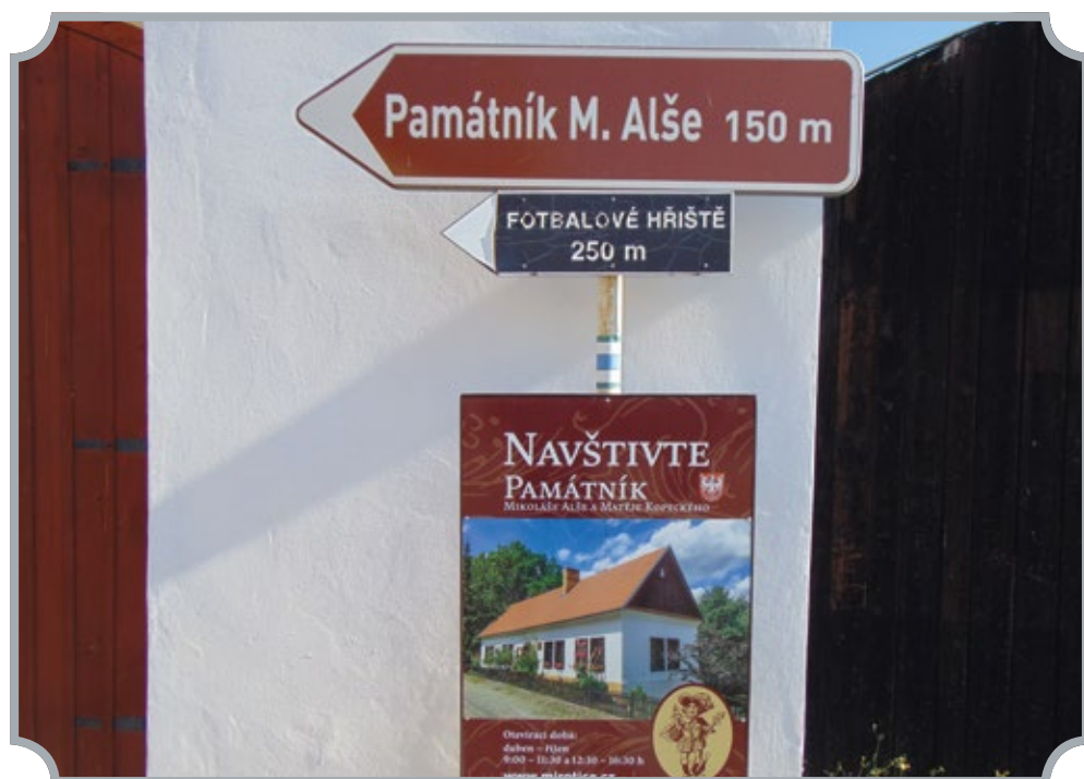
Památník stojí nedaleko náměstí.

Alšův rod žil v Miroticích od roku 1712. Praděd malíře tam byl dokonce purkmistrem. Budoucí věhlasný umělec spojený s Národním divadlem prožil v domku a jeho okolí ve skromných podmínkách pěkné dětství. Už jako malý rád maloval. „Pokud paměť má sahá, kreslil jsem odjakživa, a ne-li to, ode čtyř let jistě. Tehdy v zimě jeli jsme s nebožkou matkou na formanském voze z Prahy, cestou stavěli jsme se na jakés hospodě, a tu já na nízké stoličce kreslil svatého Václava,“ vzpomínal v dospělosti. Dochovala se i některá Alšova vysvědčení. Nejstarší z nich pochází z roku 1865. Další z gymnázia je psáno švabachem. Jiné pochází ze třetí třídy vyšších škol reálných v Písku z roku 1869. Ze všech předmětů měl Aleš trojku nebo