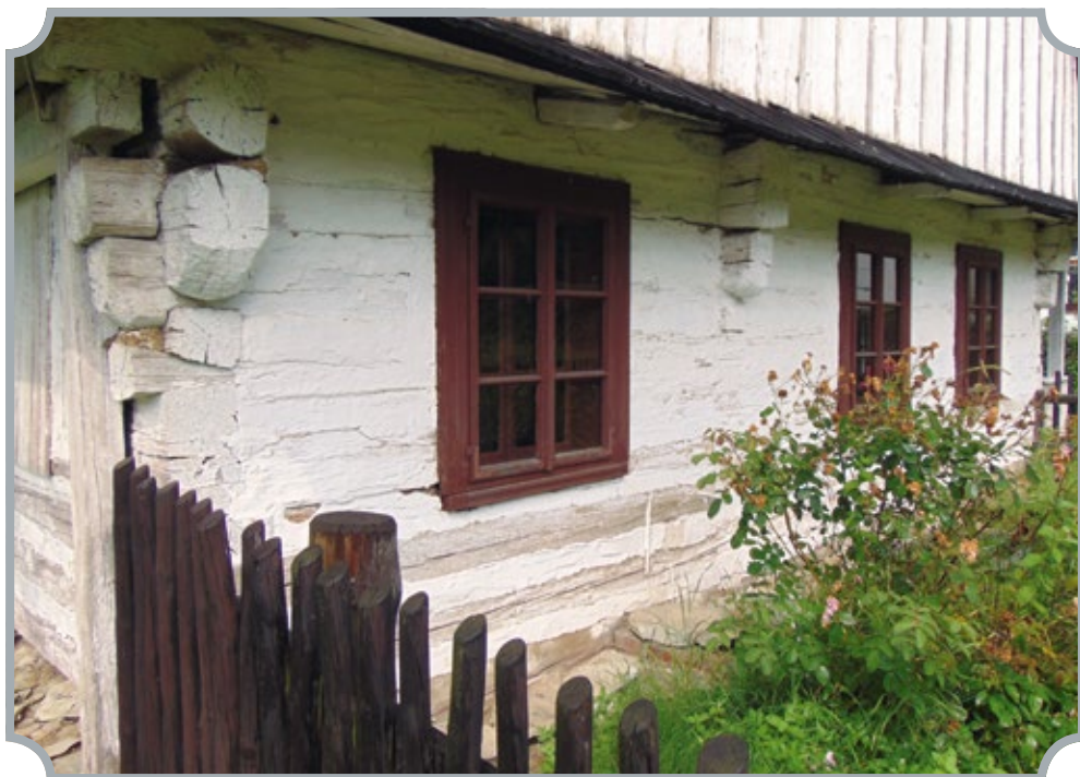
Domek je přístupný od května do září.

Zkoumal statickou elektřinu. Sestrojil si přístroj, který tvořila skleněná koule ve stojánku, při jejímž otáčení a tření získával elektřinu. Přišel na