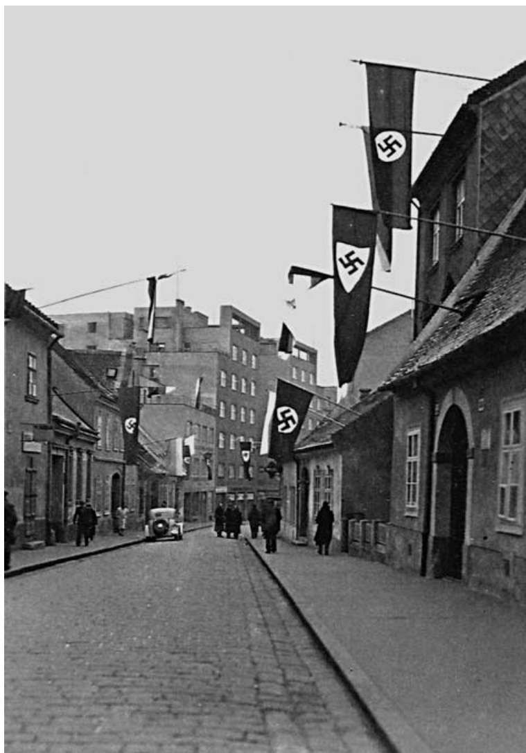
Vysoká ulica v nových časoch.