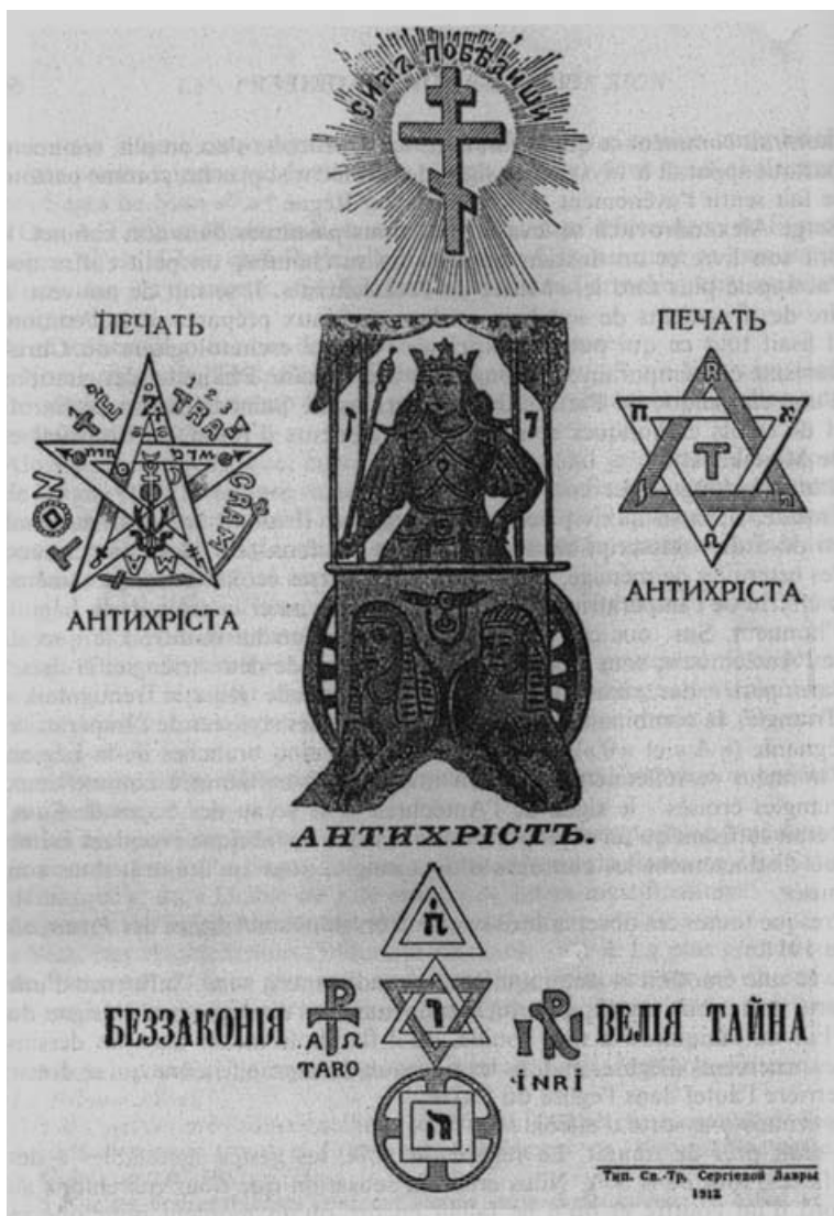
Ilustrácia v knihe Sergeja Nilusa Velikoje v malom i Antichrist (vydanie z roku 1911), ktorá obsahovala text Protokolov sionských mudrcov.