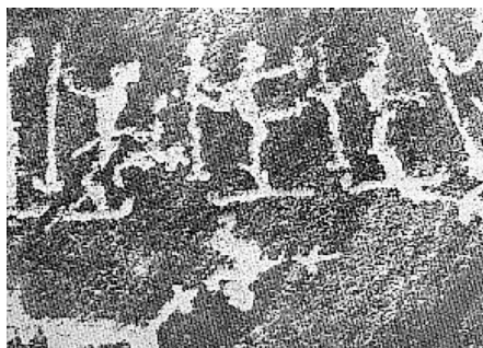
Lyžaři z doby kamenné