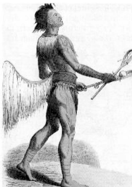
Indiánský hráč předchůdce hry lacrosse v slavnostním úboru

Zároveň pohyb v individuální rovině byl jako biopsychosociologický jev spojený s uvolněním, hrou, rozptýlením, zábavou a soutěžením v kolektivu. V sociální rovině se od počátku projevoval jako sociální jev, determinovaný jak sociálně-kulturní úrovní konkrétní společnosti, tak i hodnotami, které tato společnost uznávala.