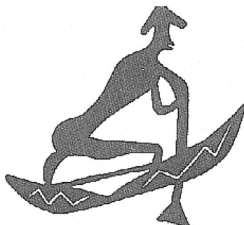
Jízda na kajaku

Postupně vznikající činnost mimopracovního charakteru (obřady formou estetického pohybu – tance, her a rituálů) je třetím z předpokladů vzniku tělesných cvičení.